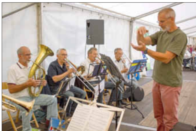
Posaunenchor im Sommerinsatz