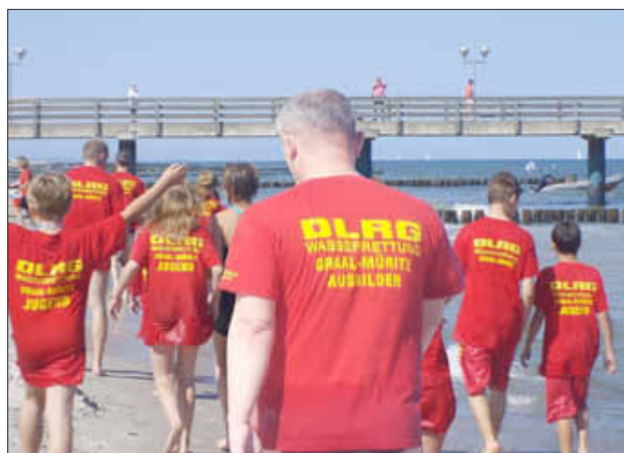
Rückkehr vom Strandtraining