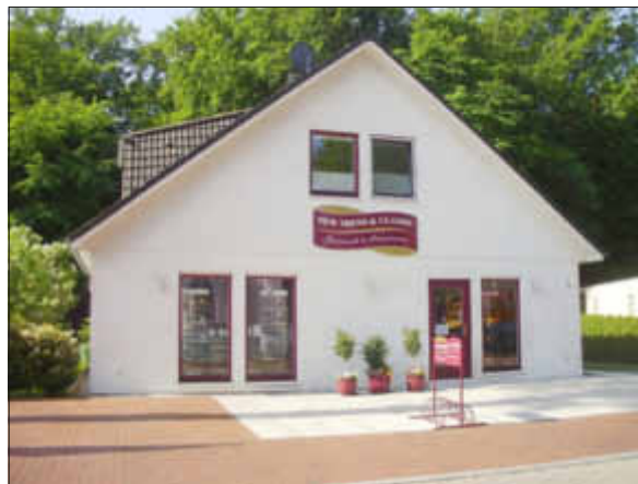
Seit Juni 1999 im modernen Ambiente: „New Trend & Classic“ heute