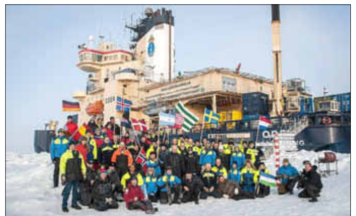
Die schwedisch-dänische LOMROG III- Expedition erreicht mit dem schwedischen Eisbrecher Oden am 22. August 2012 den Nordpol.

http://sverigesradio.se/sida/artikel.aspx?programid=2108&artikel=5261833