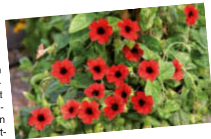
Mit neuen, ausdrucksvollen Farben begeistert die Schwarzäugige Susanne „Arizona Red Colours“.

Tipp: Stabile Stäbe geben den kräftigen Schlingpflanzen Halt. Sie sollten nicht entfernt, sondern mitgepflanzt werden. Arbeiten Sie beim Pflanzen Langzeitdünger in den Boden ein; das sorgt ohne Gefahr für einen langen üppigen Blütenflor über viele Monate.