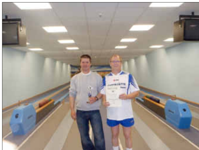
Das Siegerpaar bei den Herren