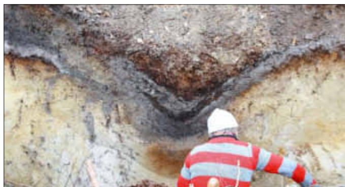
Aus den farblich und vom Material her unterschiedlichen Schichten entnehmen die Forscher wichtige historische Daten.