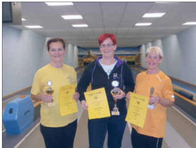
Die Pokalgewinner bei den Damen

Spendenbescheinigungen werden ausgestellt