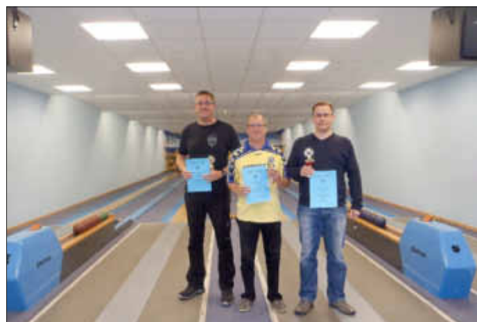
Die Gewinner bei den Herren Einzel