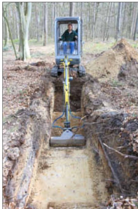
Der Stich durch den Wall wird ausgebagert.