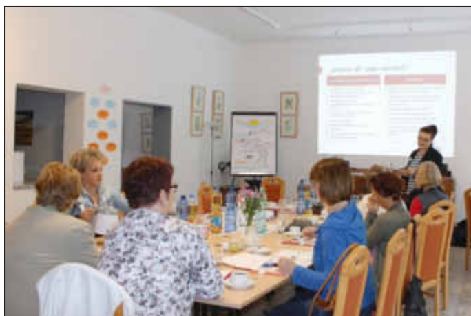
An drei intensiven Schulungstagen wurden die künftigen Helfer für die Demenzbetreuung ausgebildet.

Der wichtigste Wettkampf ist der Bundeswettbewerb der Deutschen Jugendfeuerwehren. Dieser Wettbewerb besteht aus 2 Teilen. Der A - Teil umfasst einen trockenen Löschangriff. Dabei können sich die vorgegebenen Wasserentnahmestellen unterscheiden. Es gibt die Varianten „offenes Gewässer“ bzw. „Unterflurhydrant“. Im B-Teil muss ein 400 m Staffellauf mit feuerwehrspezifischen