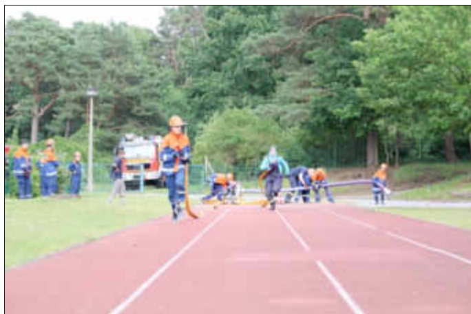
Löschangriff - Training für den Wettkampf - Lauf zum Zielbehälter