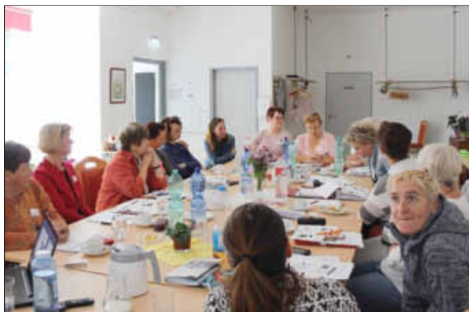
Theorie und Praxis standen im Vordergrund, aber auch für den einen oder anderen heiteren Moment blieb Zeit.