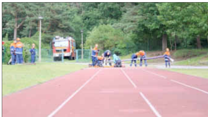
Löschangriff - Training für den Wettkampf - Kuppeln der Schläuche