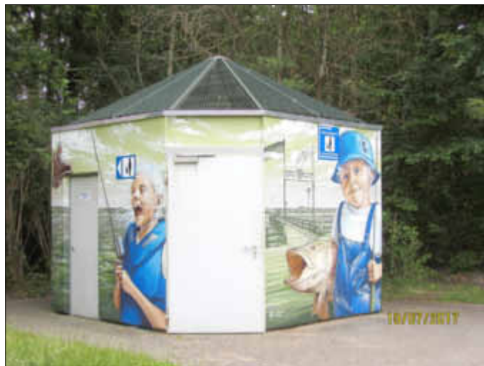
Die WC-Anlage am Parkplatz, Straße ZUR OSTSEE