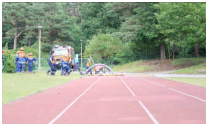
Löschangriff - Training für den Wettkampf - Start