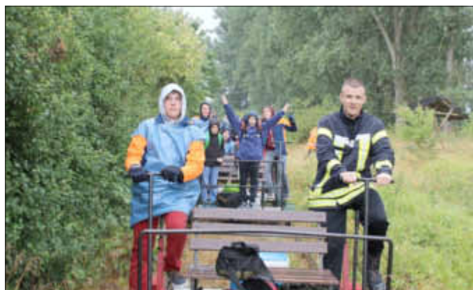
Schnapsschuss vom Zeltlager der Jugendfeuerwehren im Sommer