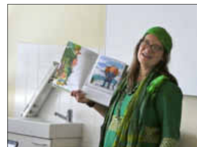
Bilder: S. Graf

Tanja Dückers wurde für ihr Werk mit zahlreichen Preisen und Stipendien ausgezeichnet, 2006 wählte das Deutsche Historische Museum Berlin sie zu den 10 wichtigsten Schriftstellern Deutschlands unter 40 Jahren (und den „100 Kreativsten Köpfen Deutschlands“). Sie lebt in Berlin, schreibt auch Bücher für Erwachsene und ist ebenfalls als Journalistin für verschiedene Zeitungen und Zeitschriften tätig.