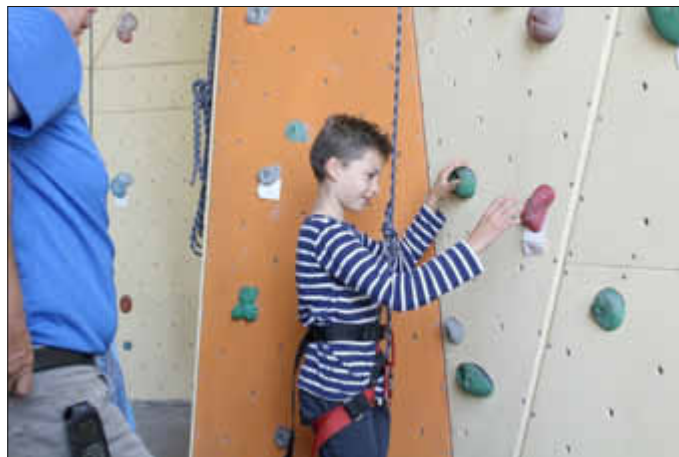
Spiel und Spaß fördert die Kameradschaft