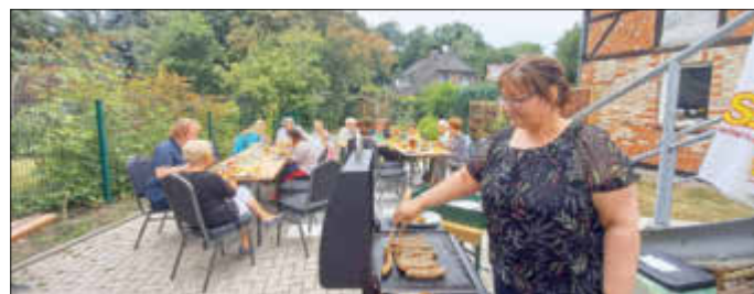
Draußen, drinnen? Kein Problem es schmeckt überall!

Sie erreichen das Team vom Bürgertreff „Onkel Bräsig“ über Tel.: 146066 oder per E-Mail: buergertreff-graal-mueritz@asb-warnow.de