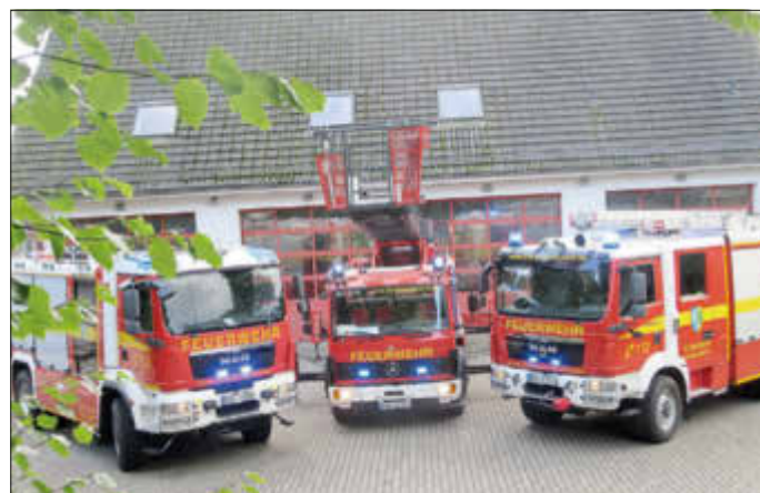
Aktuelle Einsatztechnik der Freiwilligen Feuerwehr. Auf dem Foto fehlen der ELW und das Mehrzweckboot.

DL 30 in die Jahre gekommen und ist gegen eine moderne DLK 23/12 ausgetauscht worden. Mit dieser Technik ist die Wehr eine der am besten ausgerüsteten Wehren im Landkreises Rostock. Mit der diesjährigen Modernisierung des Gerätehauses wurden für die Kameradinnen und Kameraden optimale Arbeitsbedingungen geschaffen. Vielen Bürgern wird nicht bewusst sein, dass die 38 aktiven Kameradinnen und Kameraden und die 2 bereits aktiven Jugendfeuerwehrmitglieder der Wehr jährlich 50 - 70 Einsätze fahren. Das Einsatzgeschehen umfasst neben Brandbekämpfung auch Tragehilfe und Türöffnung für den Rettungsdienst, allgemeine Hilfeleistungen (Ölspur, Baumhindernis etc.), Wassergefahren und Einsätze außerhalb von Graal-Müritz. All das in der Freizeit und unentgeltlich. Um sachkundig an der Einsatzstelle agieren zu können benötigen wir eine sehr gute Ausbildung. Lehrgänge finden an der Landesfeuerwehrschule Malchow und an den FTZ'n (Feuerwehrtechnische Zentrale) des Kreises in Kägsdorf bzw. Güstrow statt. Sehr wichtig dabei ist auch die regelmäßige Standortausbildung zu den Dienstabenden alle 14 Tage.