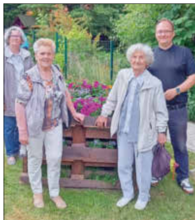
Zierliche Gewächse (im Hochbeet) und zum Teil erfahrene Gärtner drum herum.