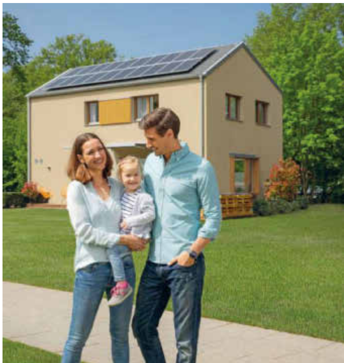
Die Baureihe sunshine kann in allen Größen als Zweifamilienhaus und auch mit Einliegerwohnung realisiert werden.

(djd). Klimafreundlich bauen rentiert sich. Sogar doppelt, wenn das Haus eine weitere Wohneinheit hat. Denn ab dem 1. Juli 2021 gibt es für ein KfW-Effizienzhaus 40 Plus bis zu 37.500 Euro je Wohneinheit vom Staat geschenkt. Die Baubegleitung wird bis zu 5.000 Euro gefördert. Bei einem Eigenheim mit einer zweiten Wohneinheit macht das insgesamt eine Förderung von 80.000 Euro anstatt der bisherigen Summe von 64.000 Euro aus. Als separate Wohneinheit konzipiert, ist eine Einliegerwohnung zudem ideal, um generationenübergreifendes Wohnen zu verwirklichen. Die Baureihe sunshine von WeberHaus beispielsweise kann in jeder Hausgröße als Zweifamilienhaus oder auch mit Einliegerwohnung geplant werden. Unter www.weberhaus.de gibt es Informationen und Wohnbeispiele.