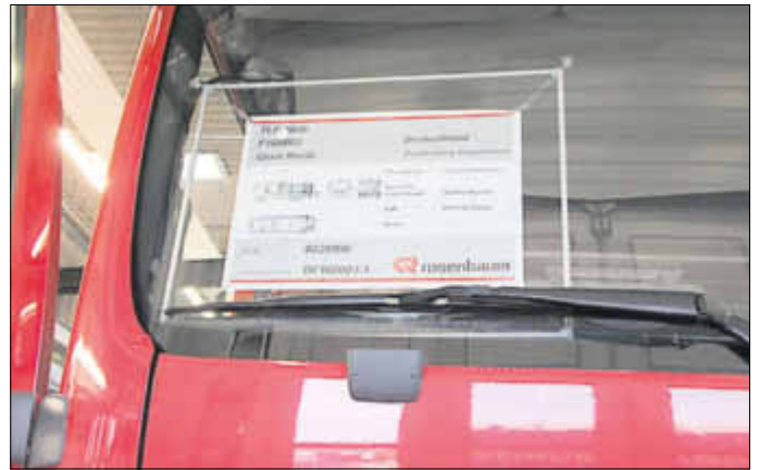
Baulosnummer und Eigentümer