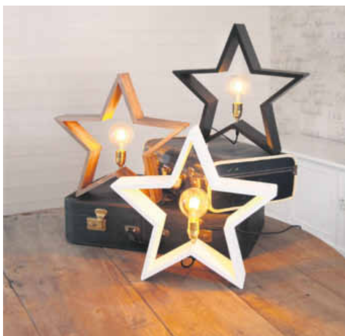
Den modern-eleganten Deko-Stern Lysekil gibt es in einer attraktiven Variante zum Hinstellen und zum Aufhängen.

auch von zu Hause aus bestellen kann. Ein strahlend schöner Weihnachtsstern im Fenster wie der modern-elegante Deko-Stern Lysekil darf dabei natürlich nicht fehlen. Bei diesem Holzstern, der in einer hängenden und einer stehenden Variante bei Lampenwelt.de erhältlich ist, wird als besonderes Highlight das Leuchtmittel offen gezeigt. Empfehlenswert ist daher ein modernes LED-Leuchtmittel, beispielsweise eine stilvolle Filament-Lampe. Dieses Leuchtmittel verbindet moderne LED-Technik mit dem klassischen Aussehen von Glühlampen. Das warme Leuchten passt hervorragend zu der behaglichen Stimmung in der Vorweihnachtszeit und wirkt besonders einladend.