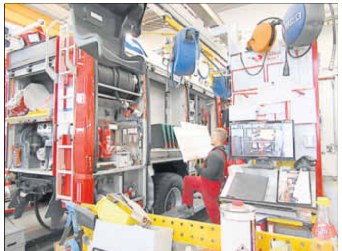
Vorbereitung der Beladung