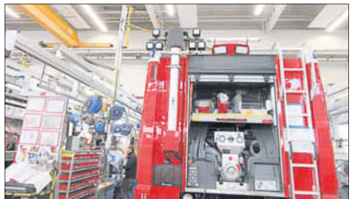
Heckansicht mit Pumpe und Teleskopmast