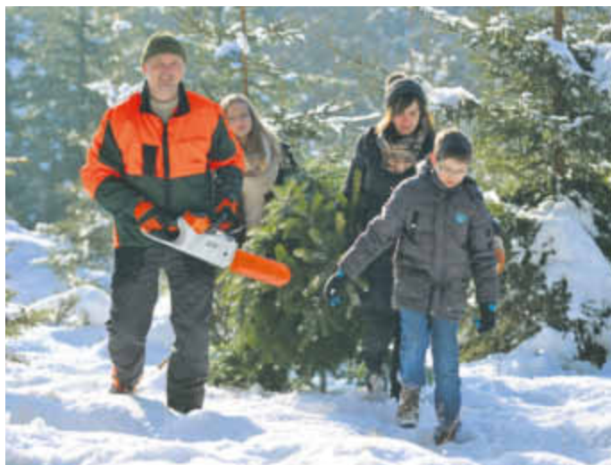
Das vorweihnachtliche Weihnachtsbaumfällen ist ein schönes Erlebnis für die ganze Familie.

Klassisch wird die Tanne mit einer Bügelsäge abgesägt. Das ist sportlich, aber auch anstrengend. Wer es lieber bequem mag, setzt auf die Motorsäge. Beim Fällen hat dann Sicherheit oberste Priorität: Unbeteiligte müssen außer Reichweite bleiben, für die Kinder sollte man am besten eine „rote Linie“ festlegen. Wichtig ist auch die Schutzkleidung: Für die Arbeit mit der Motorsäge bedeutet das Schnittschutzhose und -schuhe, Arbeitshandschuhe, Gehörschutz und eine Brille, die vor Holzspänen schützt. Ideal zum Fällen des Weihnachtsbaums sind Akku-Motorsägen. Sie verfügen über eine gute Schnittleistung, sind schnell gestartet, abgasfrei und leise, so dass der Gehörschutz überflüssig wird. Das Modell „Stihl MSA 160 C-BQ“ etwa ist mit seinen nur 3,3 Kilogramm (ohne Akku) noch dazu leicht zu transportieren. Und falls es doch die Handsäge sein soll. Sie gibt es vom selben Hersteller auch mit extrascharfer Japanzahnung.