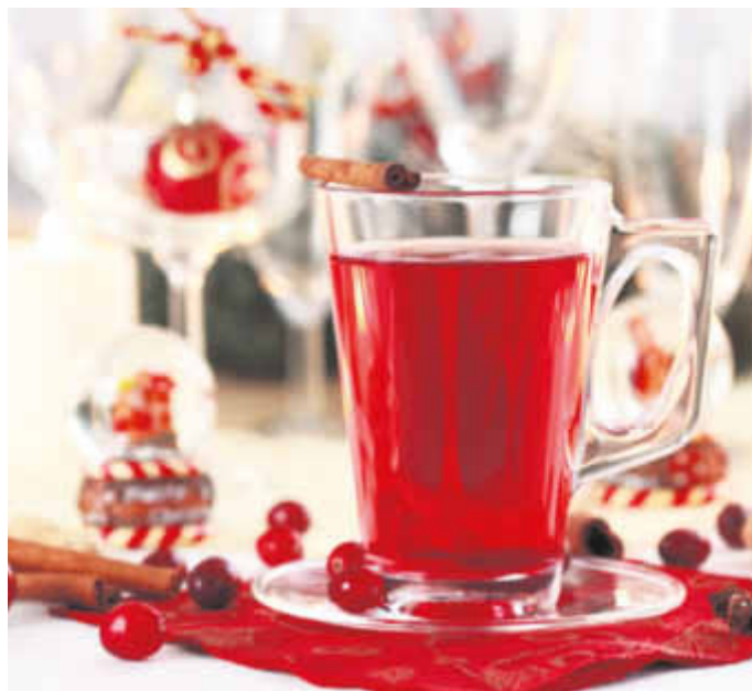
In der Weihnachtszeit sind insbesondere heiße Cocktails bei Genießern beliebt.

(djd). Für jeden das richtige Weihnachtsgeschenk zu finden, ist gar nicht so einfach. Besonders Menschen in der zweiten Lebenshälfte machen es einem nicht leicht, das passende Präsent auszuwählen. Einerseits haben sie bereits alles, andererseits sind sie oft besonders anspruchsvoll und genießen ihr Leben bewusst. Was liegt da näher, als ihnen zum Fest der Liebe feine Genüsse wie elegante Schokoladen oder edle Spirituosen zu überreichen?