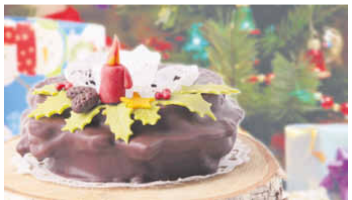
Für jeden dritten Deutschen ist Baumkuchen in der Adventszeit unverzichtbar.

(djd). Weihnachten ohne Plätzchen und Schokolade kann sich niemand vorstellen. Wie eine Nielsen-Studie ergeben hat, kaufen die Deutschen rund 600 Gramm Weihnachtssüßigkeiten pro Jahr. Ganz oben in der Gunst liegt der Schokoladen-Weihnachtsmann, gefolgt von Marzipan und Adventskalendern.