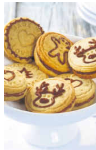
Die gestempelten Doppelkekse sind mit einer Nuss-Nougat-Creme wie Nutella gefüllt.