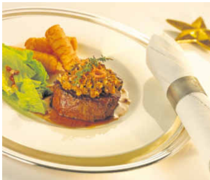
Filetmedaillons mit Maronenhaube sind schnell zubereitet.

(djd-p/el). Lecker, schnell und einfach zubereitet: Für besondere Anlässe ist man oft auf der Suche nach einem festlichen Gericht, für das man nicht stundenlang in der Küche stehen muss. Bewährt hat sich hier zum Beispiel zartes Rinderfilet, das sich besonders zum Kurzbraten oder Braten eignet. Rinderfilet in Pfeffersoße, mit Olivenkruste oder im Blätterteigmantel - das zarteste Stück vom Rind lässt sich vielseitig zubereiten und macht sich gut auf jeder Festtafel.