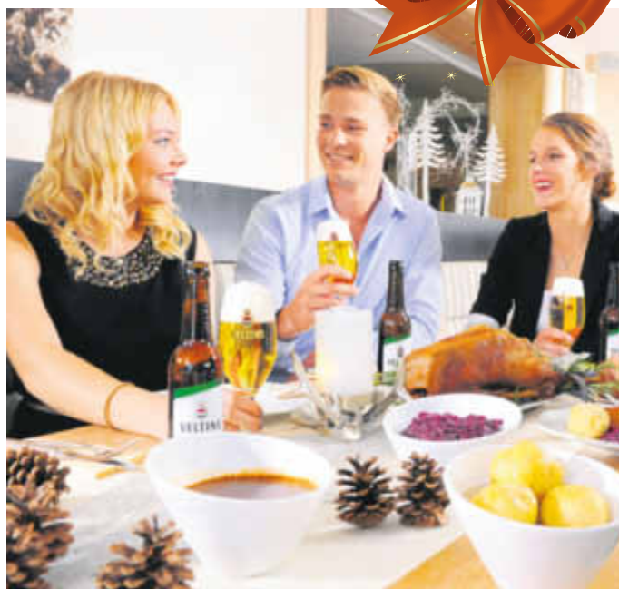
Die knusprige Weihnachtsgans mit Kößen und Rotkohl zählt zu den „Klassikern“ an den Feiertagen.