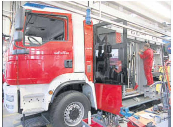
Einbau der Gerätefächer