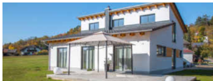
Zur ökologischen Effizienz eines Eigenheims trägt die Wahl des passenden Wandbaustoffes entscheidend bei. Mauerziegel überzeugen hier auf mehreren Ebenen: Sie sind hoch wärmedämmend und besonders langlebig.

(djd). Bei der Planung der eigenen vier Wände legen angehende Eigenheimbesitzer zunehmend Wert auf Nachhaltigkeit. Dabei spielt die Ökobilanz der Wandbaustoffe eine wesentliche Rolle. Ziegelhäuser erreichen auch in dieser Hinsicht sehr gute Werte, wie eine aktuelle Studie des Münchner Forschungsinstitutes für Wärmeschutz (FIW) zeigt. Ein Grund für die gute Bilanz des massiven Baustoffes: Während einer Nutzungsdauer von rund 80 Jahren sparen hoch wärmedämmende Ziegelwände viel Energie ein. Dabei stellen nadelholzgefüllte Mauerziegel als Hybridvariante eine besonders ökologische Lösung dar, unter www.unipor.de finden sich dazu viele Informationen.