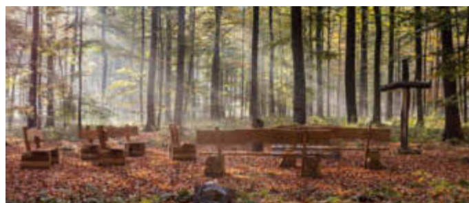
Ein Andachtsplatz in einem Bestattungswald - seit 20 Jahren sind in Deutschland Beisetzungen unter Bäumen möglich.

(djd). Naturverbunden, schlicht und tröstlich: Seit 20 Jahren gibt es in Deutschland die Möglichkeit, unter einem Baum im Wald die letzte Ruhe zu finden. Als 2001 im Reinhardswald bei Kassel der erste FriedWald eröffnete, war die Bestattung in der Natur noch ungewöhnlich. Doch sie lieferte den Startschuss für einen Wandel in der Bestattungskultur: weg von vorgegebenen starren Strukturen, hin zu mehr Individualität. Laut einer aktuellen Studie nimmt inzwischen der tröstliche Wald Platz zwei auf der Liste der bevorzugten Bestattungsorte ein. Interessierte finden nähere Infos etwa unter www.friedwald.de .