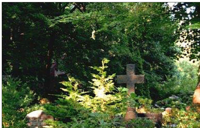
Der Graal-Müritzer Friedhof bringt noch zahlreiche historische Grabsteine, die erhalten werden sollen.