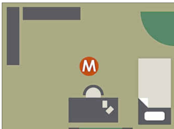
Installation des Rauchmelders in einer Kleinwohnung