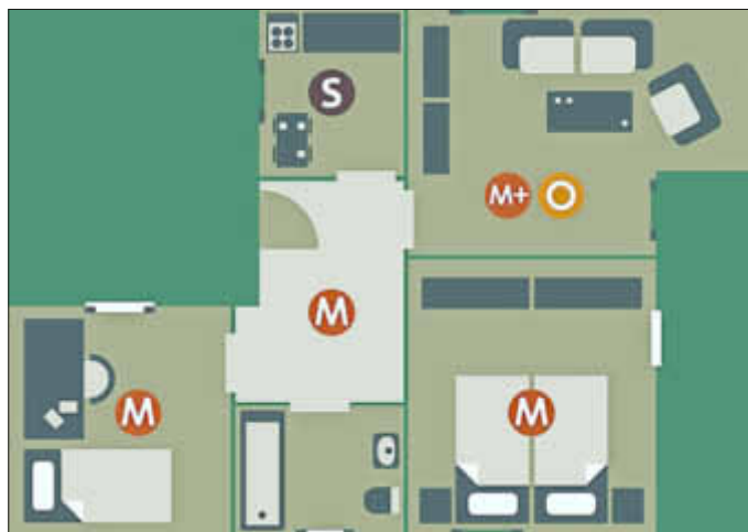
Installation der Rauchmelder in einer 3-Zimmer-Wohnung