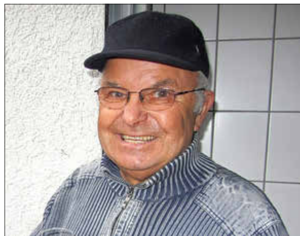
Immer mit Spaß dabei – so kannten wir dich.

In Ehre gedenken wir seiner und behalten ihn für immer in Erinnerung.