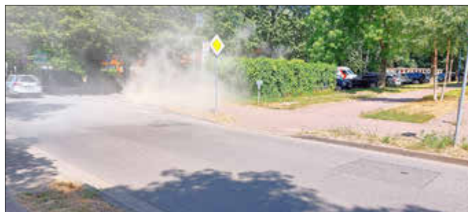
Auch hier war es Unachtsamkeit, die zu dem Feuer führte.