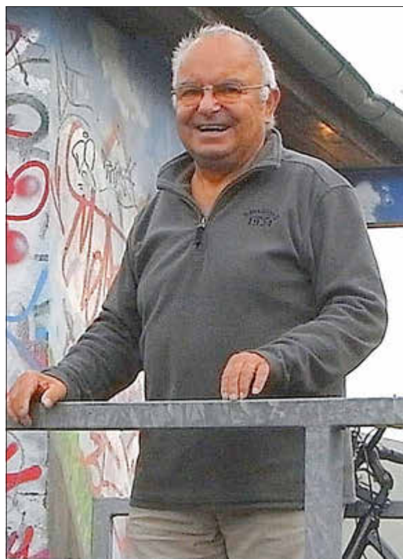
Deine Freundlichkeit wird uns in Erinnerung bleiben.

Die Kameradinnen und Kameraden der Wasserwehr Ostseeheilbad Graal-Müritz