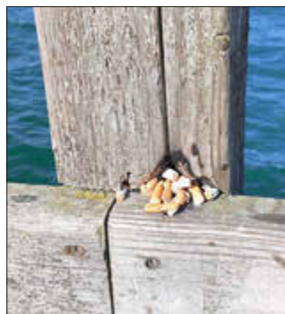
Unverantwortlich. Liebe Raucher, ein (Taschen)Aschenbecher ist da sinnvoll!