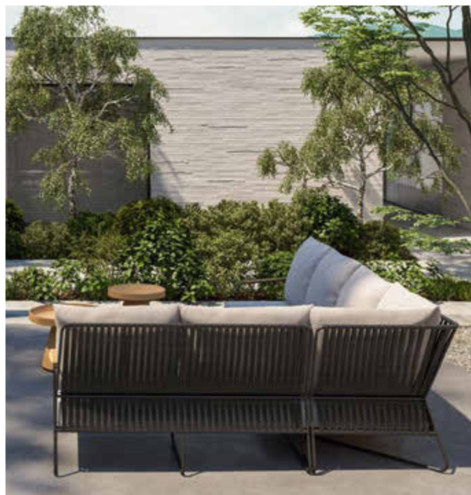
Für gemütliche Grillabende und Familienfeste unter freiem Himmel: Mit schönen und bequemen Loungemöbeln lässt sich die Freizeit auch draußen zelebrieren.

(djd). Einfach zurücklehnen, ein gutes Buch lesen oder Musik hören und den Alltagsstress ganz schnell vergessen: Der eigene Garten oder Balkon ist für viele der Lieblingsort, um zu entspannen. Großen Wert legen viele Gartenbesitzer dabei auf hochwertige, bequeme und gleichzeitig pflegeleichte Outdoormöbel. An einem hochwertigen Esstisch mit komfortablen Stühlen schmecken das Familienfrühstück am Sonntag oder die Grillspezialitäten noch besser. Optisch dazu passend gibt es Sessel, Liegen und modular erweiterbare Sitzgruppen für draußen. Moderne Synthetikgewebe und Rope-Qualitäten wie von 4 Season Outdoor sind UV-beständig und einfach zu reinigen. Unter www.4seasonsoutdoor.de beispielsweise finden sich weitere Inspirationen und Einrichtungstrends für die Gartensaison 2023.