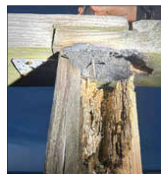
Das ist die Konsequenz, wenn das Holz als Aschenbecher genutzt wird.