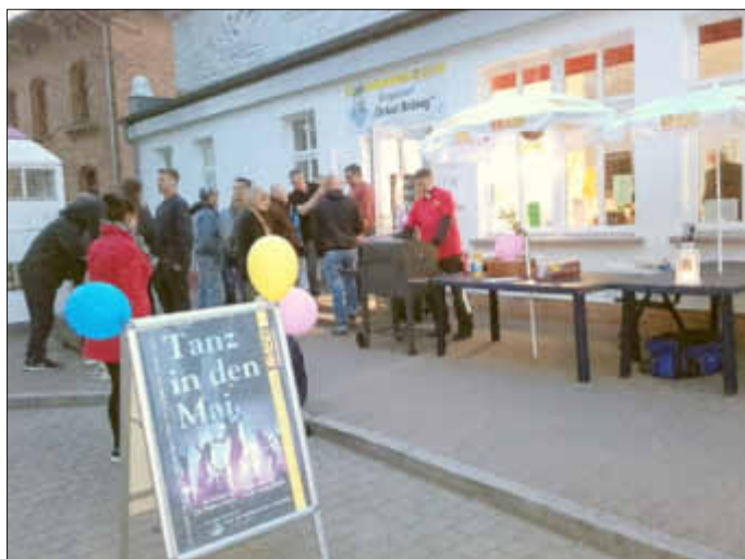
Jung und Alt beim Abkühlen am Bratwurststand vereint, bevor wieder das Tanzbein geschwungen wird.