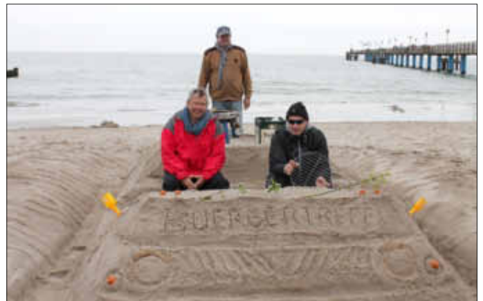
Prototyp vom Bürgerbus der Gemeinde