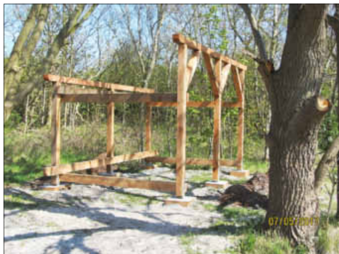
Bereits am 7. Mai waren die Umriss der Hütte zu sehen.