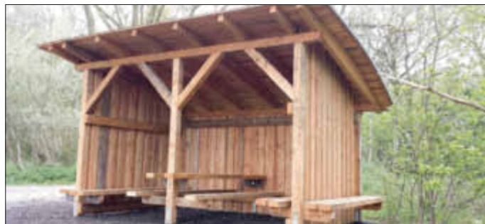
Am 12. Mai stand die neue Wetterschutzhütte.