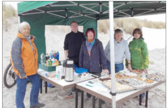
Vielen Dank an das Team vom Servicewohnen, welches sich um Speis und Trank kümmerte