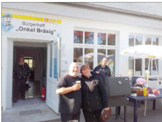
Etwas Zeit für Spaß mit den Musikern bevor es richtig los geht. Die fleißigen Helfer sind bereit!

Für diese Rückschau können wir das Datum der Veranstaltung ganz entspannt weglassen. Fakt ist jedenfalls, dass Sie sich ein solches Angebot wünschen. Und das wurde an diesem Abend oder eher in dieser Nacht auch deutlich. Gut, dass man draußen ebenfalls herumstehen konnte. Sonst wären wir schnell an unsere Grenzen gestoßen. Das Publikum vertrug sich trotz des teilweisen Altersunterschiedes von 60 Jahren ziemlich gut. Wer sagt eigentlich, dass man im hohen Alter nicht auch noch richtig abhotten kann und will? Und so ist unser Wunsch, einen Bürgertreff für alle zu schaffen, bei diesem Tanz erfüllt worden. Das Ende lag wie vorhergesagt schon im neuen Monat. Wir freuen uns über eine gelungene Veranstaltung.