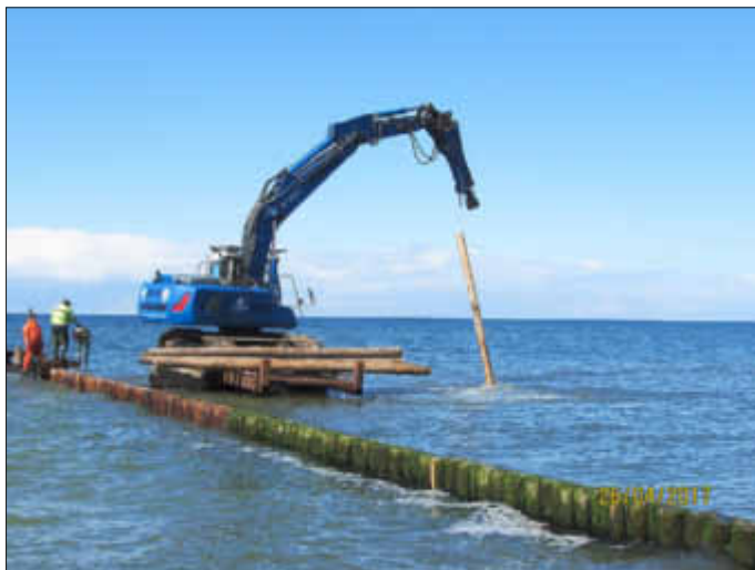
Neue Pfähle werden in die Lücken der Bühnen eingesetzt.

Seit dem 2. Mai 2017 fährt eine neue, blaue TUKI-Bahn durch unseren Ort. Die alte grün-gelbe war nach 16 Jahren Dienst in Graal-Müritz technisch verschlissen und entsprach nicht mehr den Ansprüchen unserer Gäste und der Einwohner. Die blaue Bahn ist auch kein Neubau, weshalb für die Einweihungsfahrt am 2. Mai die Bezeichnung JUNGFERNFAHRT nicht ganz richtig war. Das im Jahr 2000 gebaute Triebfahrzeug wurde 2012 generalüberholt und erhielt im vorigen Jahr einen Toyota-Austauschmotor (4,2 Liter Turbodiesel, 6 Zylinder, 149 PS). Auch die beiden Anhänger wurden 2012 überholt und sind mit einer Heizung ausgestattet. Die Eintrittsstufen sind bequemer, und der hintere Wagen besitzt sogar eine Rollstuhlrampe. Wer diese nutzen möchte, sollte sich vorher mit den Kollegen im Haus des Gastes in Verbindung setzen. Von allen anderen Vorteilen gegenüber der in den Ruhestand versetzten Bahn werden Sie sich bestimmt selbst überzeugen können. Nur so viel schon im Vorab: Der Zug DBR TK 600 ist leiser und mit den knapp 20 Meter Länge nicht zu übersehen. Die Sitzplatzzahl hat sich auf 54 erhöht.