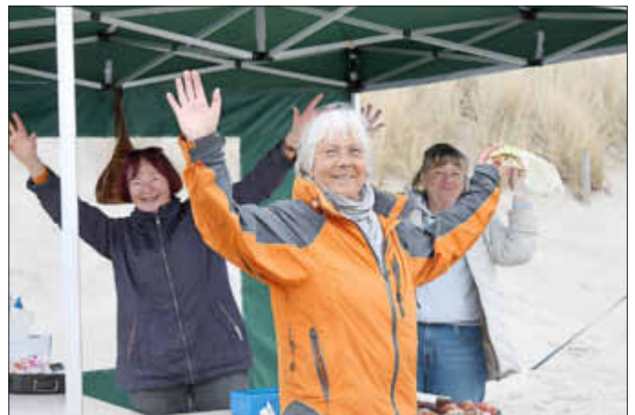
Gewonnen? EGAL! Spaß und Freude hat es allen gemacht.