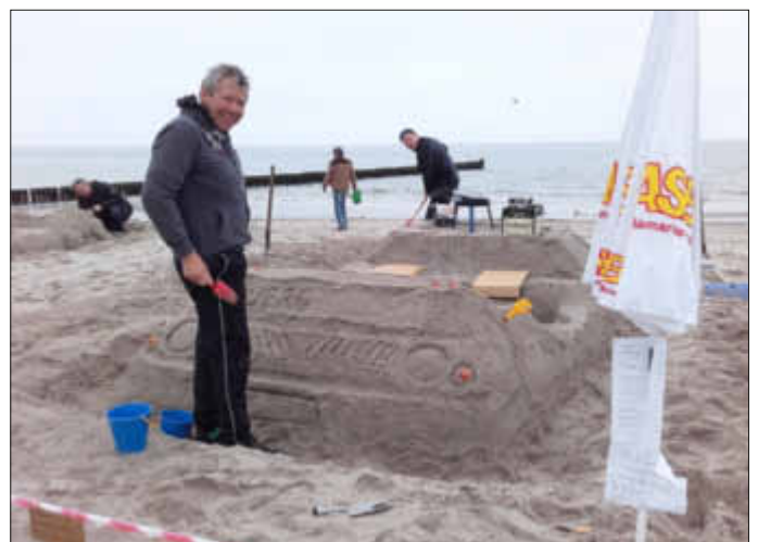
Vorsicht Werkstatt, na kann man schon das Ziel erkennen?