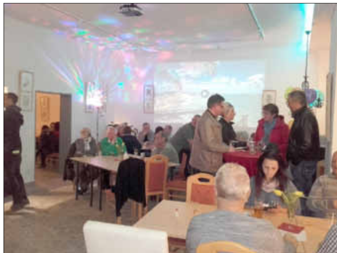
Alles gesittet und ordentlich, zumindest als das Bild gegen 20:00 Uhr entstanden ist. Keine Sorge, ich kann schweigen.