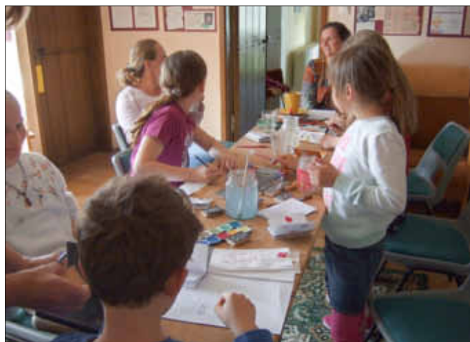
Nach der Vorlesestunde am Nachmittag wurde ein Comic gestaltet.