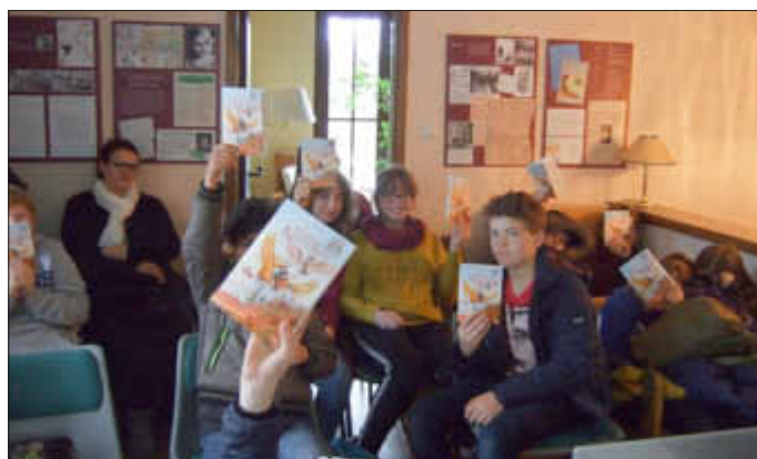
Besuch der 5. Klassen der Europaschule Rövershagen zum Tag des Buches!

Willkommen zur Literaturwoche 2019! Wir freuen uns auf Sie!