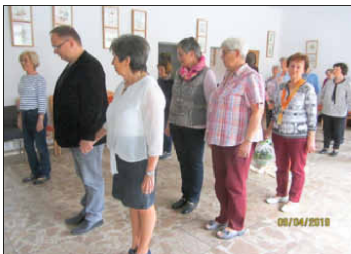
Den Gästen machte das Tanzen auch Spaß.