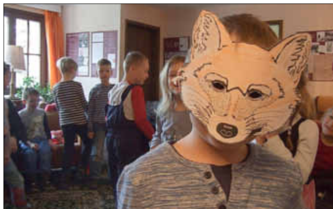
Die Vorschule besucht die Bibliothek!

Und hier noch ein paar Impressionen von verschiedenen Veranstaltungen zur Leseförderung in der Bäderbibliothek!