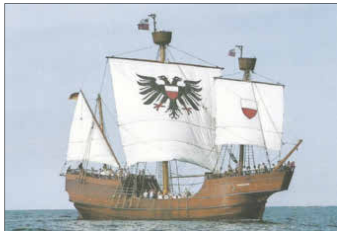
Kraweelnachbau „Lisa von Lübeck“

dern ein viel mächtigeres ungewöhnliches Holzteil mit seinem Greifer aus der Tiefe an die Oberfläche hievte und direkt vor unsere Füße auf den Strand beförderte. Ein genauer Blick - und für mich keine Frage - einige Spuren menschlicher Bearbeitung ließen sich daran erkennen. Sollte es wirklich ein Wrackteil sein und aufgrund der Größe aus der Segelschiffszeit? Wie jetzt weiter, wir debattierten ein wenig, eigentlich sind die Firmen ja gebrieff, solche Funde zu melden, vielleicht war denen jedoch nichts aufgefallen. Noch bevor wir nach Hause gelangten, trafen wir die Entscheidung: Es musste gehandelt werden. Sofort ging ich ins Heimatmuseum und bat Museumsleiter Joachim Weyrich um Hilfe. Dabei setzte ich alles auf eine Karte, denn natürlich konnte ich zu diesem Zeitpunkt noch überhaupt nicht sicher sein, wirklich ein historisches Wrackteil gefunden zu haben. Joachim Weyrich setzte alle Hebel in Bewegung und organisierte in Windeseile Dank unserer Freiwilligen Feuerwehr ein Bergungskommando. Gemeinsam mit Thomas und Kai Kröpelin nebst Fahrzeug erreichte ich bereits nach gut 30 Minuten die Fundstelle - doch das schwere Teil war schon weg! Es fand sich schließlich aber noch auf dem Bühnenlagerplatz an der Wiedortschneise wieder, um gerettet und zum Museum transportiert zu werden.