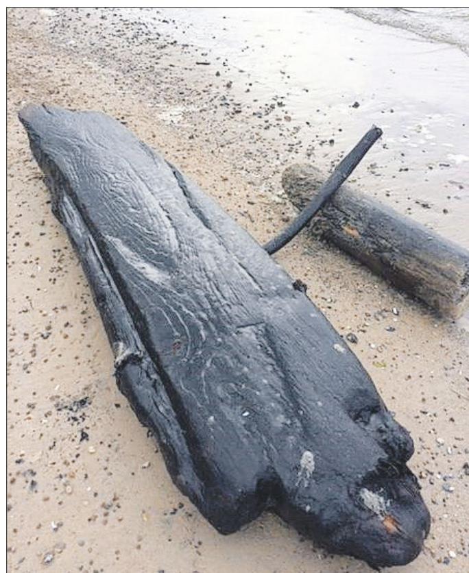
Fundort mit Steventeil