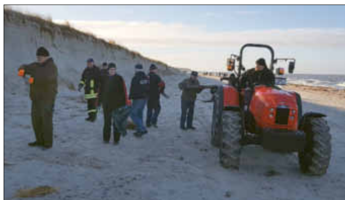
Auf der anderen Seite, Abtransport durch Firma Witt