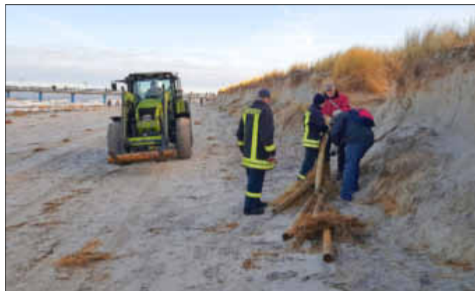
Abtransport durch Firma Ihle.