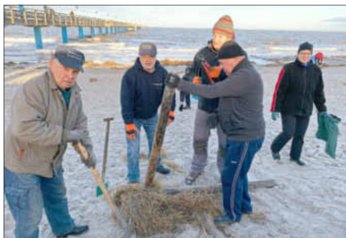
Was kann noch wiedergenutzt werden?