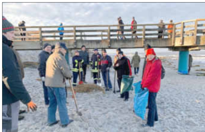
Arbeitsbesprechung und Einteilung der Gruppen.