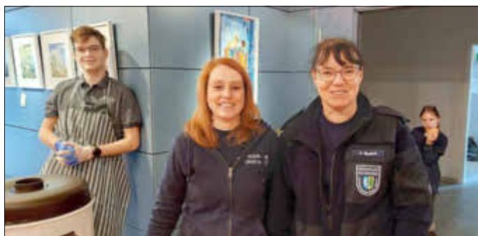
Zwei der fleißigen Helfer. So musste niemand hungrig nach Hause gehen.