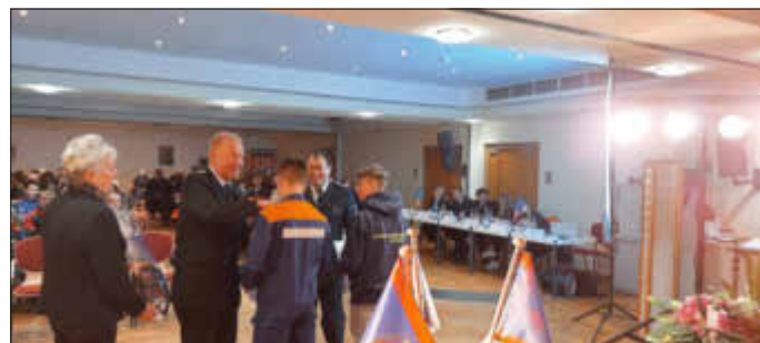
Ehrung von 2 Jugendfeuerwehrkameraden mit der Ehrennadel der Jugendfeuerwehr des Landkreises Rostock

Ihr/Euer Florian , der sich freut, wenn das Zusammenspiel funktioniert.