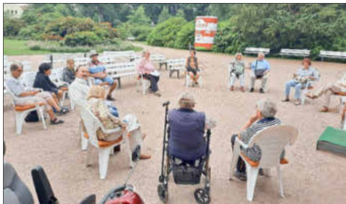
Lyrikbuche 2021, da waren wir flexibel. Mal unter der Buche, mal im Pavillon und mal davor (damit wir bei Regenschauer nicht so weit flüchten müssten).

PS: Ich tu noch zwei, drei oder mehr Bilders vom anderen Sommer dieses Jahr rein, so als Erinnerung, denn alles war ja nun auch nicht schlecht!