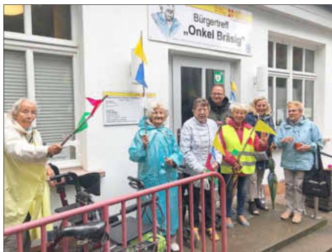
Und natürlich haben wir uns auch für die Friedensfahrt schick angezogen und mit Winkelementen ausgerüstet unser Posten bezogen.

Sie erreichen das Team vom Bürgertreff "Onkel Bräsig" über Tel. 146066 oder per E-Mail: buergertreff-graal-mueritz@asb-warnow.de