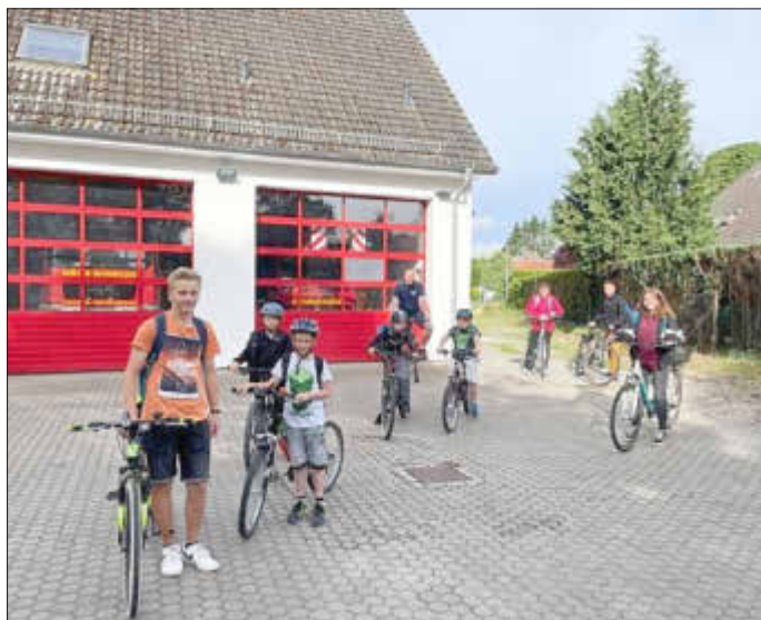
Start zur Fahrradtour

Unsere First Responder überbrückten in dieser Saison in vielen Einsätzen das therapiefreie Intervall bis zum Eintreffen des Regelrettungsdienstes und dessen Notärzten. Insgesamt rückte unsere Einheit zu mehr als 75 Einsätzen aus, wovon mehrere