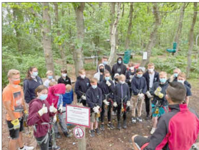
Einweisung - auch im Kletterwald steht die Sicherheit und das korrekte Verhalten ganz oben.