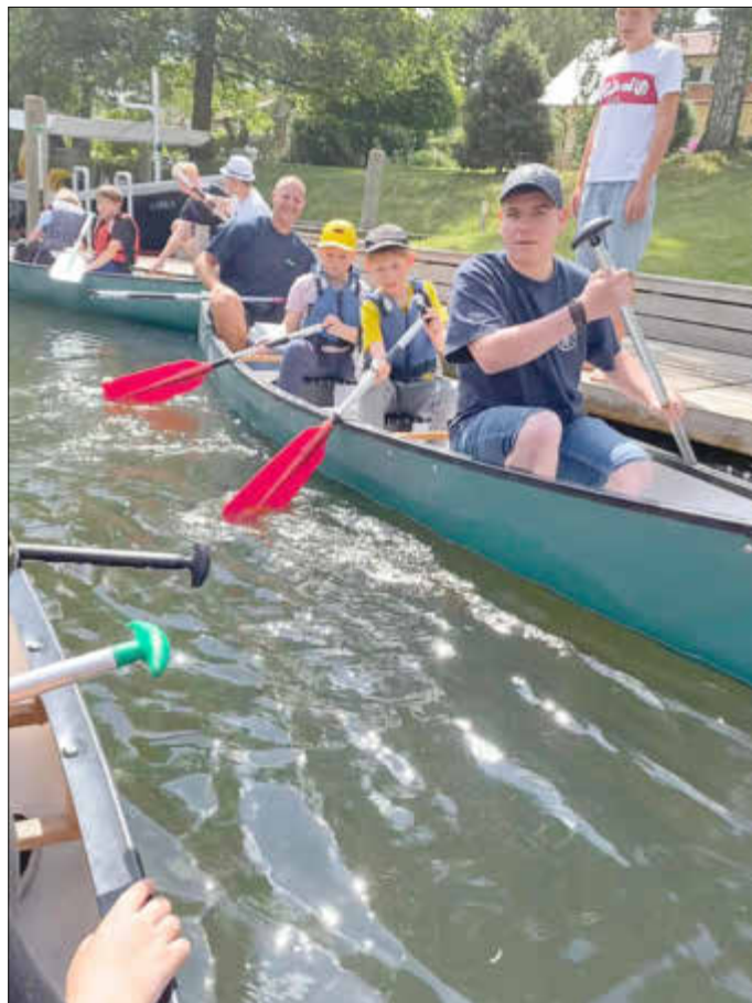
Kanutour - na, wer war am Ende mehr geschafft?