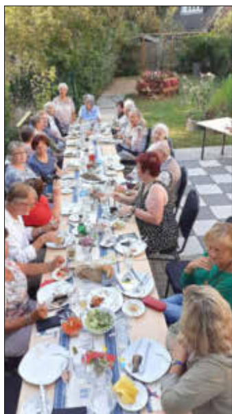
Ein gedeckter Tisch und wem es auffällt, die Teller sind fast alle schon leer gegessen. Wir waren also nicht schuld am verregneten Sommer