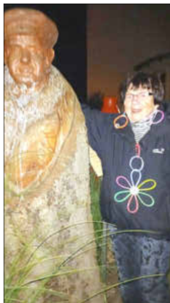
Ja und in Leuchtschale haben wir uns auch geworfen. Man/ Frau muss ja schick zu Nachts im Park aussehen.