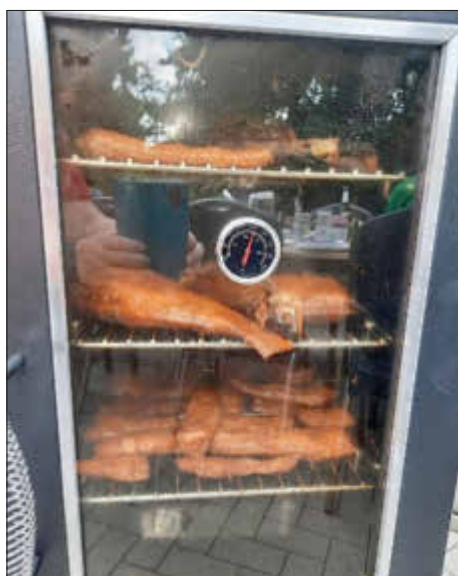
Die Fischlein im Ofen wurden öfter geknipst als die Weinstöcke im Garten, egal- lecker war beides.