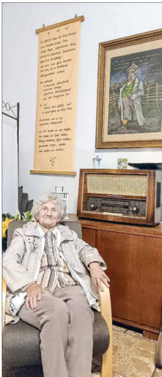
Wichtig und nicht vergessen, immer genug Zeit zum Wohlfühlen einplanen, wenn ihr bei mir zu Besuch kommt.