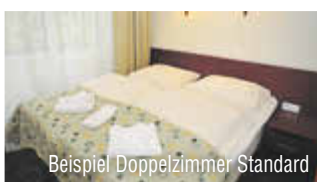
Beispiel Doppelzimmer Standard

TERMINE & PREISE in €/Person im DZ Standard