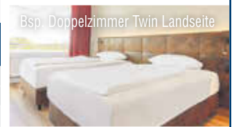
Bsp. Doppelzimmer Twin Landseite