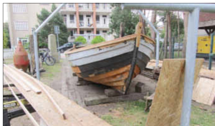
Die „Reparaturwerft“ vor dem Museum