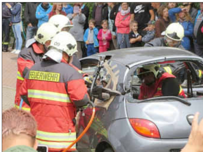
Einsatz der Rettungsschere