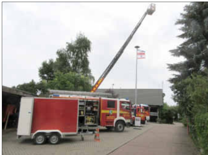
Die Technik ist „angetreten“.