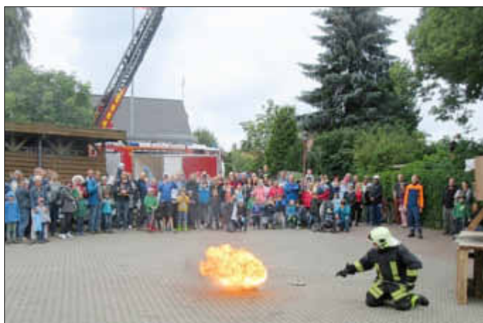
Brennendes Fett und Wasser - eine hochexplosive Mischung