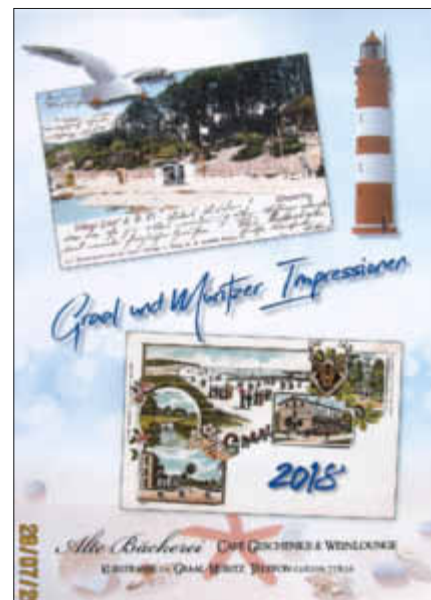
Titelblatt des neuen Kalenders der „Alten Bäckerei“