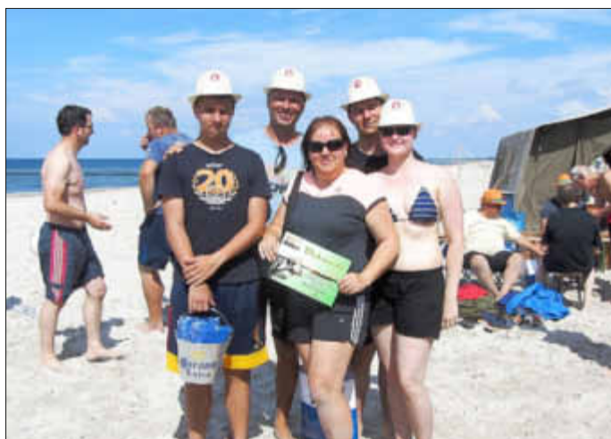
Platz 2 für die „Familienbande“

Am Sonntag fand das interne TSV-Turnier statt. Hier kämpften 10 Mannschaften aus Graal-Müritz um eine gute Platzierung. Sieger wurden erwartungsgemäß die Volleyballspieler vom TSV. Den zweiten Platz hatte die „Familienbande“ Völpel belegt, gefolgt von den Ü 50-Fußballern, dem „Donnerstagstrupp“ Fußball, den TSV-Handballjungs, der Gruppe „Real Graal“, den Rettungsschwimmern der DRLG, den „Strandhoppern“, der „Invalidentruppe“ und den „Batboys“. Es war ein Riesenspaß für die Spieler und die Zuschauer und ein grandioser Erfolg für die vielen fleißigen Organisatoren, Helfer, Sponsoren und die Unterstützer aus dem Rathaus und dem Kurpark/Wirtschaftshof.