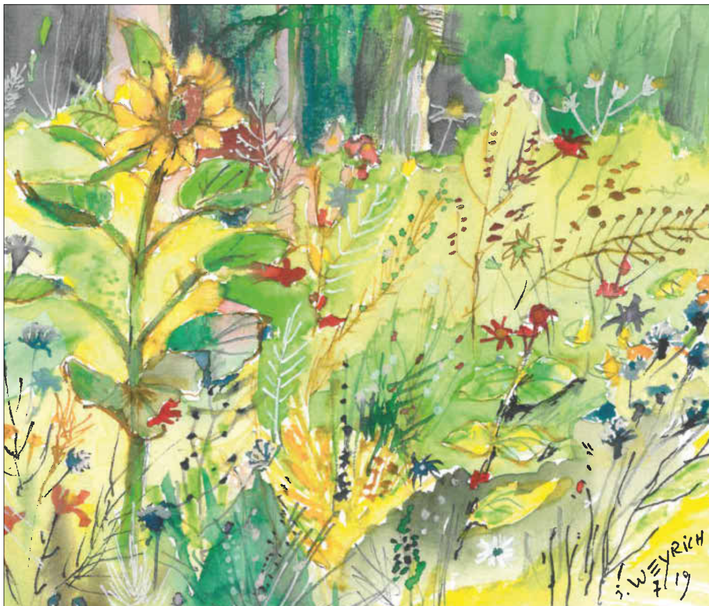
Aquarell von Joachim Weyrich