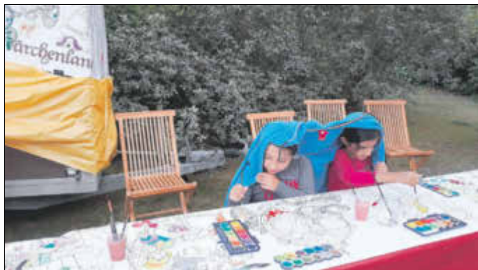
Ein bisschen Regen hält doch keine kleinen Künstler auf.