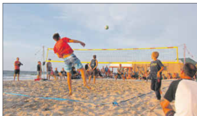
Spannendes Endspiel der Herren kurz vor Sonnenuntergang