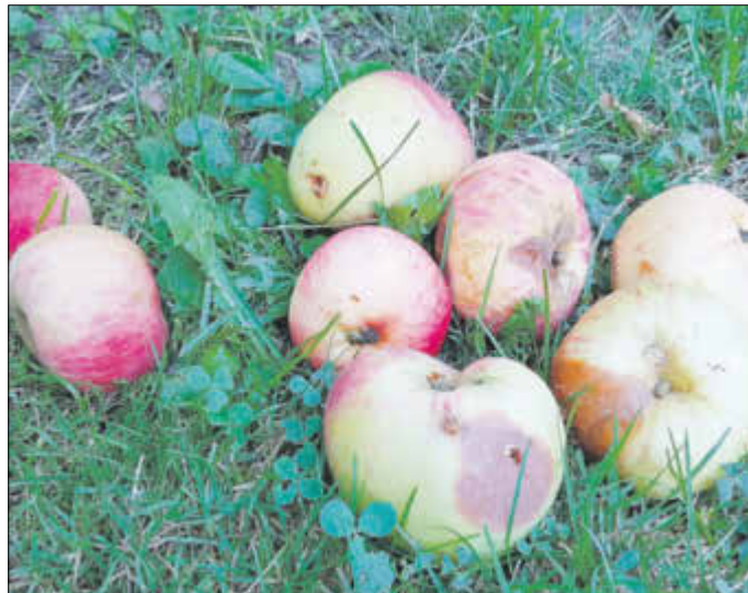
Fallobst wirkt wie ein Magnet.

den Pulsschlag von Grundstückseigentümern und Kleingärtnern so richtig nach oben. Es gibt aber auch Gäste, die vor der „schwarzen Bestie“ Furcht haben. Wildschweine sind wilde Tiere und diesem Denkmuster folgen sie auch. Die Bache führt ihre Frischlinge zum Fraß und wägt sehr genau ab, worauf sie sich einlassen kann. Dabei zieht sie je nach Lebensalter eine Einschätzung aus der Situation, die sie vorfindet und gleicht das mit ihrem Erfahrungsschatz ab. Daraus erfolgt die entsprechende Reaktion. Alles was vom Geruch her sich unter die Überschrift „Fraß“ einordnen lässt, ist für unsere Schwarzkittel interessant. Das kann einerseits der gut bestellte Garten sein, insbesondere in der jetzigen Jahreszeit mit dort vorhandenem Fallobst.