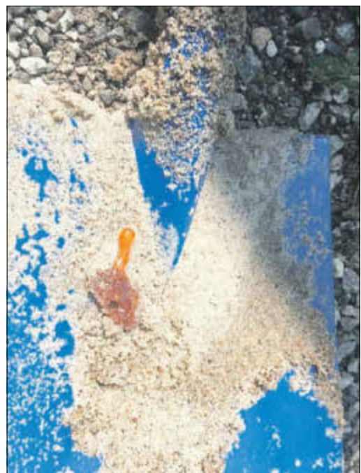
Leider kann man die helle kleine blaue Flamme auf dem Bild nicht richtig erkennen.