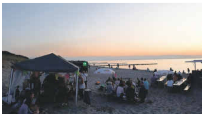
Kulinarisch, musikalisch, romantisch und vor allem mit vielen Freunden - chill und grill am Strand - eine schöne Veranstaltung, dank vieler helfender Hände.