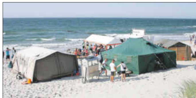
Das Versorgungszentrum für die Gäste