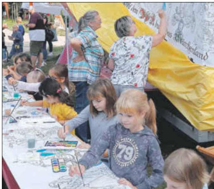
Spaß für Groß und Klein, am längsten Märchen-Malbuch rechts von Rostock - nur echt bei der Märchennacht im Park.

Wenn auch du mit uns etwas Besonderes für unsere Gemeinde realisieren möchtest, dann nimm Kontakt auf. Sie erreichen das Team vom Bürgertreff "Onkel Bräsig" über Tel. 146066 oder per E-Mail: buergertreff-graal-mueritz@asb-warnow.de