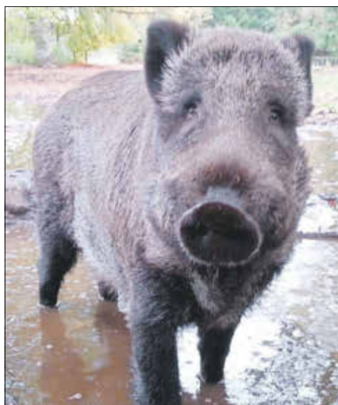
Ein Wildschwein in der Wohlfühlphase

Die Begegnung Mensch - Wildschwein braucht man nicht fürchten. Meist sind die Sauen bereits weg, wenn man an die Stelle kommt, wo sie vor einer halben Minute noch waren, man riecht sie höchstens noch. Oder Sie als Passant werden durch die Schwarzkittel als unproblematisch eingeschätzt und können denen in gewissem Abstand zuschauen. Ganz anders sieht es aus, wenn Hunde ins Spiel kommen, egal wie groß. Selbst darauf ausgebildete Jagdhunde ziehen bei Kontakt mit Wildschweinen durchaus den Kürzeren. Ihr Hund ohne Jagderfahrung ist auf die Begegnung überhaupt nicht vorbereitet und weiß daher nicht, häufig genau so, wie der begleitende Mensch, was gleich passieren wird. Der Angriff erfolgt immer überraschend, bei Einzelstücken direkt. Bei einer Bache mit Frischlingen kann es passieren, dass diese erst flüchten, die Bache die Frischlinge dann an einem für sie sicheren Ort verbringt und dann in voller Fahrt zurückkommt, um ihren Hund zu attackieren. Vermeiden Sie weitsichtig solche Begegnungen, leinen Sie Ihr Tier an, um jederzeit die Kontrolle zu haben.