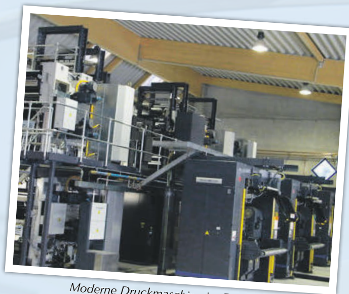
Moderne Druckmaschine im Druckhaus Herzberg.

Das Team der LINUS WITTICH Medien KG in Sietow