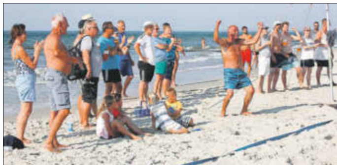
Begeisterte Zuschauer feuern die Spieler an