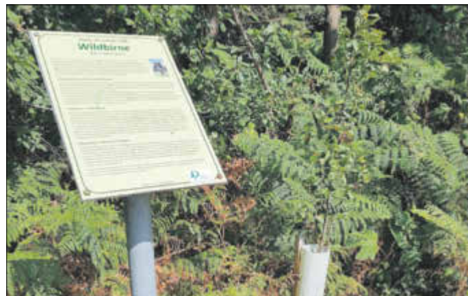
Die Wildbirne, Baum des Jahres 1998, am Pfad „Baum des Jahres“

Die Pflanzung und Beschilderung der Bäume des Jahres im Lindenweg ist eine gemeinsame Aktion der Jagdgenossenschaft (Zusammenschluss der Landeigentümer) und der Jäger. Diese finanzieren und unterhalten mit Unterstützung der Gemeinde die Flächen. Nun soll da nicht ein neuer Wald entstehen, wir möchten damit vielmehr auf die Aktion „Baum des Jahres“ aufmerksam machen und auch mal zeigen, wie der Baum dann aussieht, man hat was zum Anfassen. Da es ein kleiner Lehrpfad vor einem höheren Baumbestand ist, sind die Jahresbäume eher von geringem Wuchs und es vertrocknet auch mal hin und wieder einer. Eine Nachpflanzung ist jetzt für den Herbst geplant.