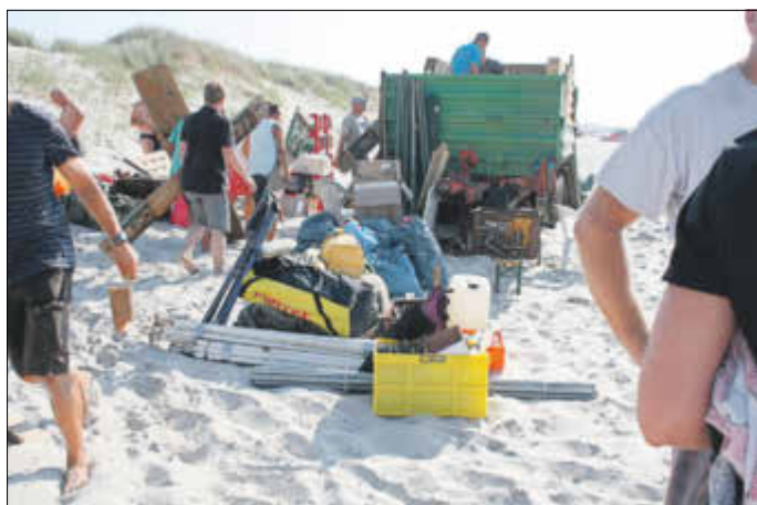
Ein kleiner Teil dessen, was abgenaut und ins Lager gebracht werden musste