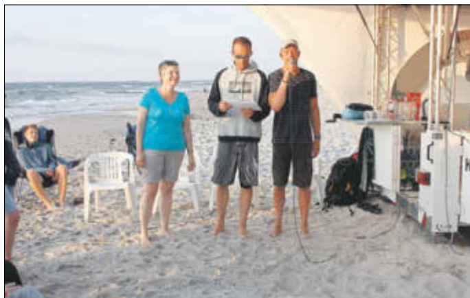
Übergabe der Urkunden und Preise mit Siegerehrung