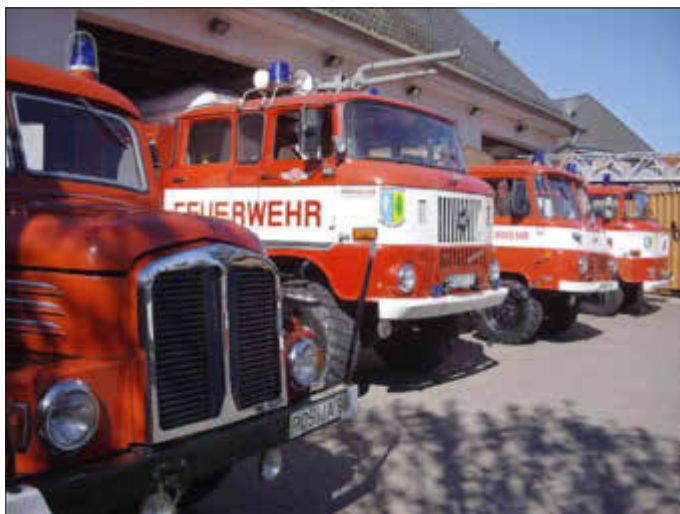
TLF 16 vom Typ S4000, TLF 16 GMK LAA auf W50, LF 8 TS 8 STA vom Typ LO 2002A und die DL 30 auf W50 von links beginnend