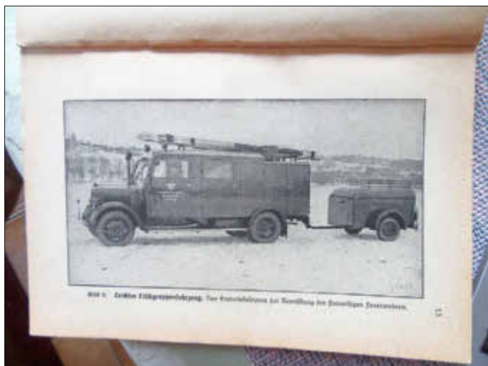
LLF 8 (Bild aus der Chronik, Quelle unbekannt)

Die nächsten Fahrten zur Tafel finden am 10. und 24. September 2021 statt.