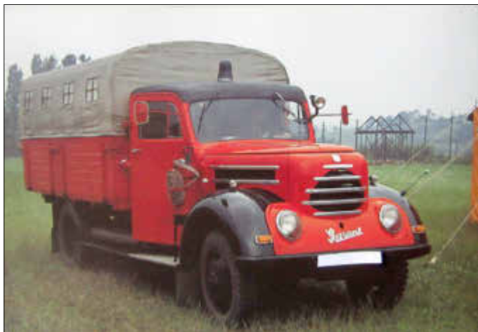
LF 8/8 STA auf Garant 30K

Ihr/Euer Florian, der sich über eine aktive Feuerwehr freut, die technisch auf dem neusten Stand ist. Ein beruhigendes Gefühl.