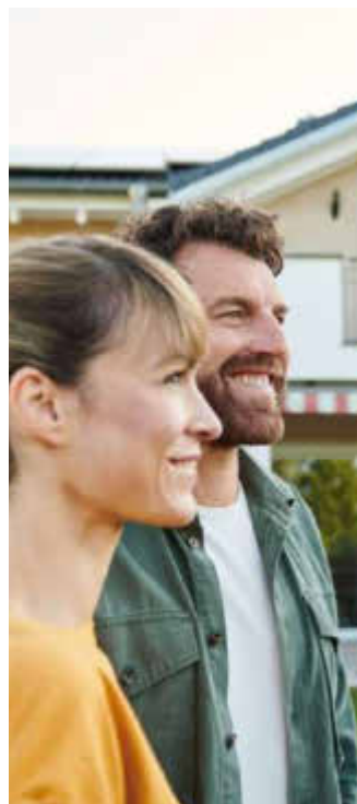
Wer heute baut, legt Wert auf wohngesunde, umweltverträgliche Baustoffe.

(djd). Bei der Planung eines Neubaus oder einer Modernisierung achtet man heute zu Recht auf wohngesunde Materialien. Denn die meiste Zeit unseres Lebens verbringen wir im Inneren von Gebäuden. Genau deshalb sind gesundes Raumklima und die Wahl der "richtigen" Bau- und Dämmmaterialien so wichtig. Auf der sicheren Seite ist man hier mit dem Hochleistungsdämmstoff Polyurethan-Hartschaum. Nach einer ausgiebigen Prüfung durch das Fraunhofer-Institut für Holzforschung Wilhelm-Klauditz-Institut (WKI) haben etwa die Dämmstoffe des Herstellers puren das Umwelt-Qualitätszeichen "pure life" erhalten. Es belegt, dass sie nachweislich gesundheitlich unbedenklich sind. Auf www.puren.com stehen dazu mehr Infos für Bauherren und Modernisierer sowie ein kostenloser Dämmratgeber zur Verfügung.