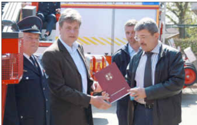
Innenminister Caffier überreicht dem Bürgermeister den Bewilligungsbescheid.