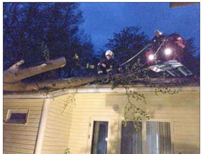
Die Zerlegung und Beseitigung des Baumes war erst bei Dunkelheit erledigt.