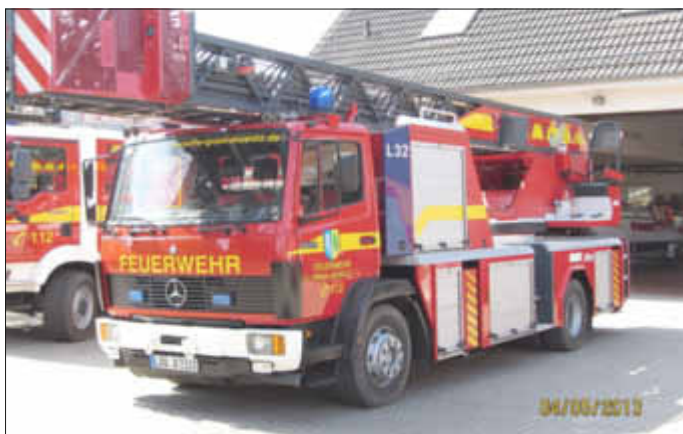
Die Drehleiter DL 23/12