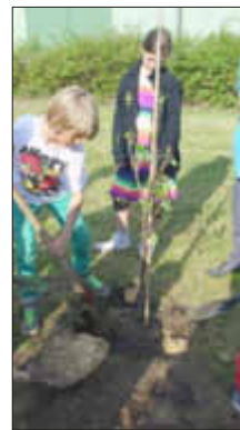
Die SchülerInnen der Klassen 4a und 4b beim Pflanzen des Apfel- und des Birnenbaumes.