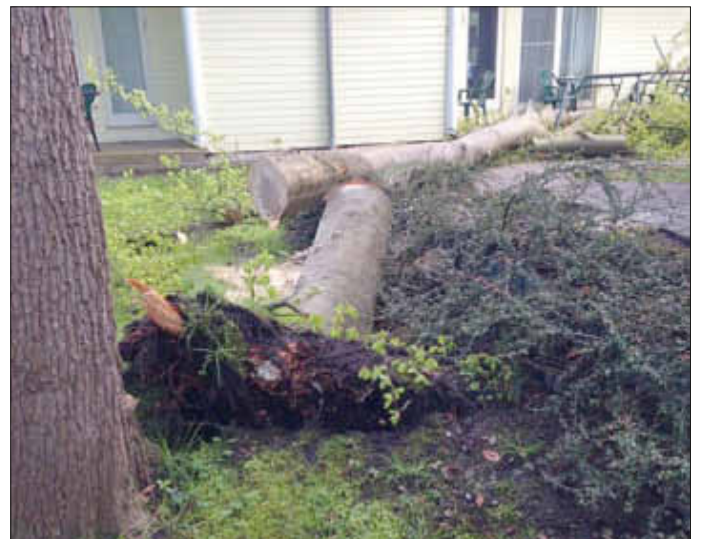
Der kleine Wurzelteller ist schon auffällig, ebenso die Flecken im Stamm.