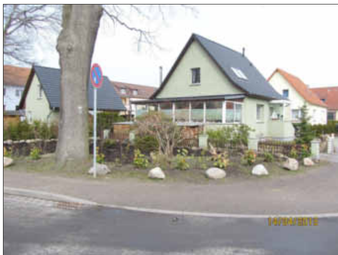
Graaler Landweg Ecke Dr.-Bach-Weg