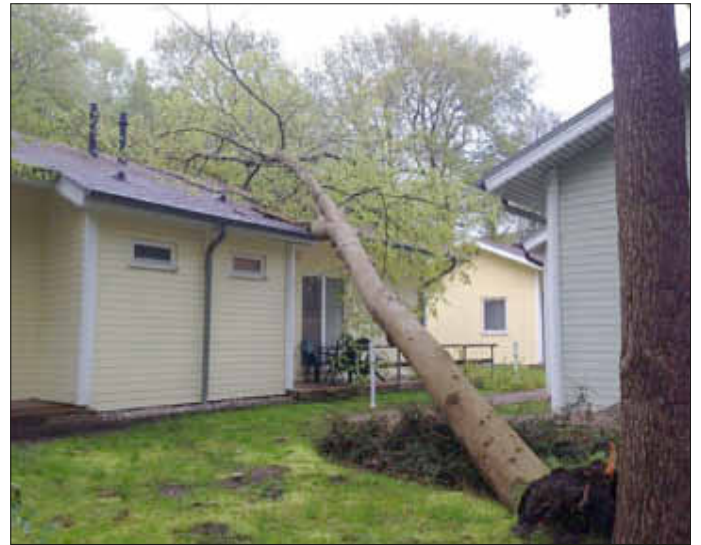
Ohne großen Schaden zu verursachen legte sich die Buche auf das Bungalowdach.