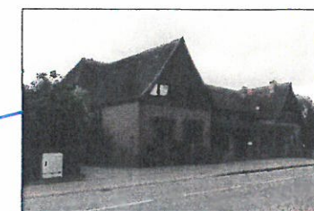
MFH, Rostocker Straße 38/40, Abmaße 29 m x 15 m