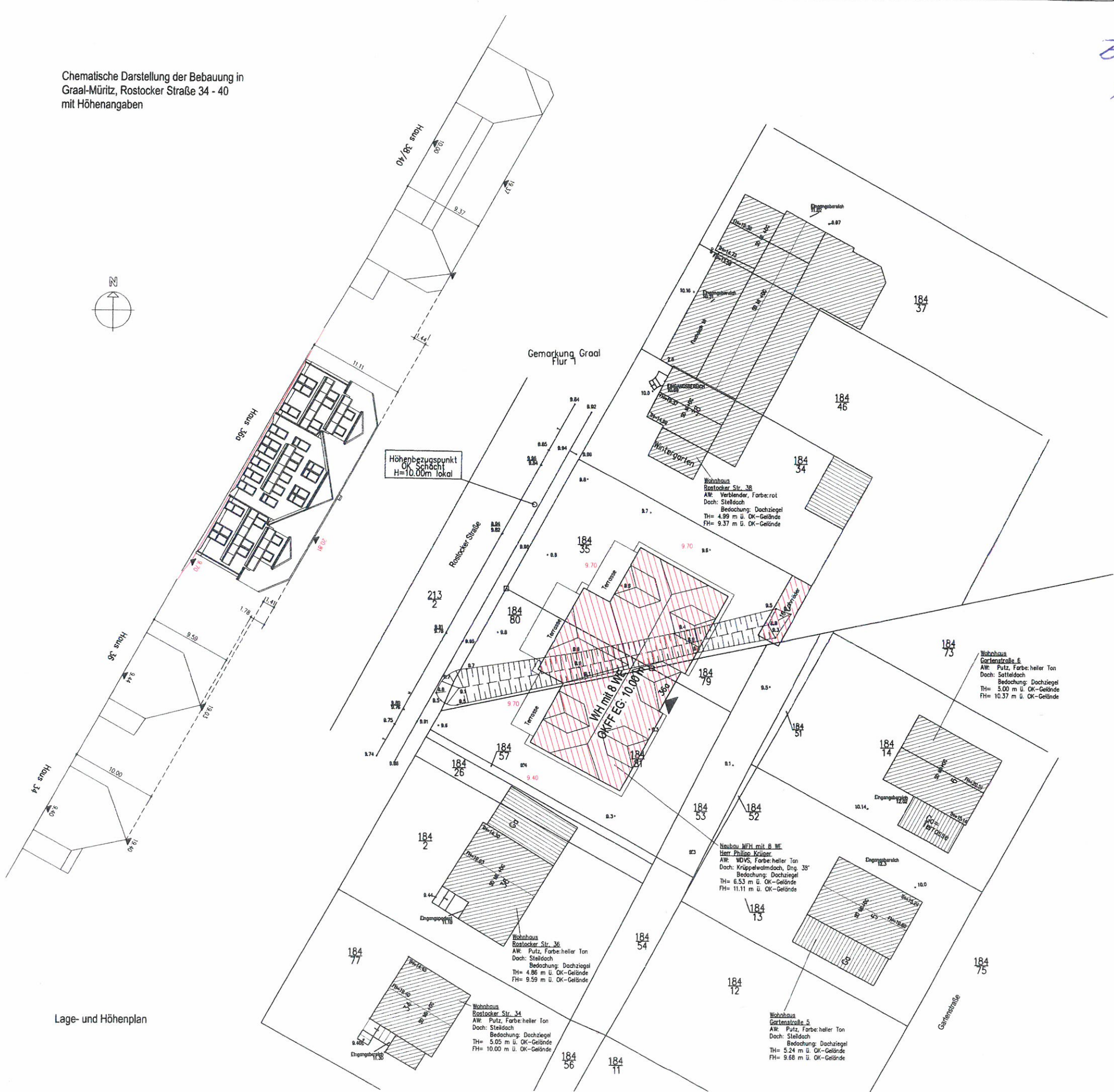
Lage- und Höhenplan