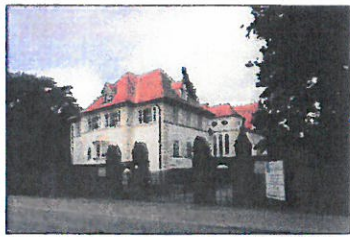
Gebäude des Reha-Zentrums, Rostocker Straße 1