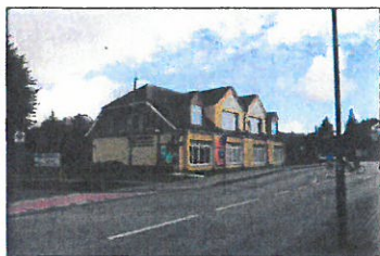
Haus des Gastes, Rostocker Straße 3