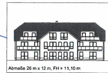
Abmaße 26 m x 12 m, FH = 11,10 m geplantes MFH, Rostocker Straße