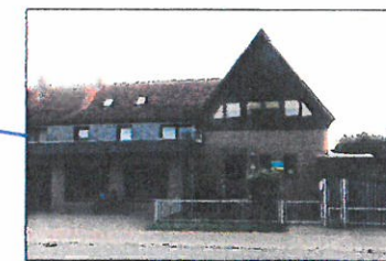
MFH, Rostocker Straße 38/40, FH = 9,37 m