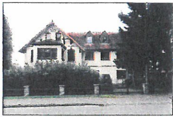
Wohnhaus, Rostocker Straße 26