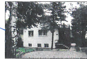
EFH, Rostocker Straße 34, FH = 10,00 m