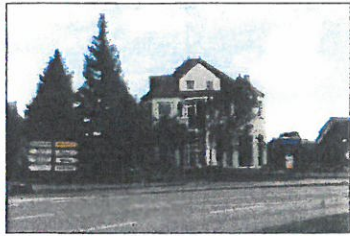
Wohnhaus Kurstraße 4