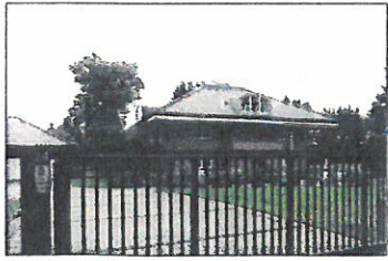
Wohnhaus, Rostocker Straße 24