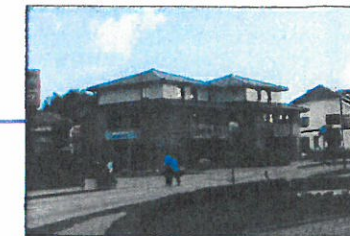
Wohn- und Geschäftshaus, Lange Straße 1