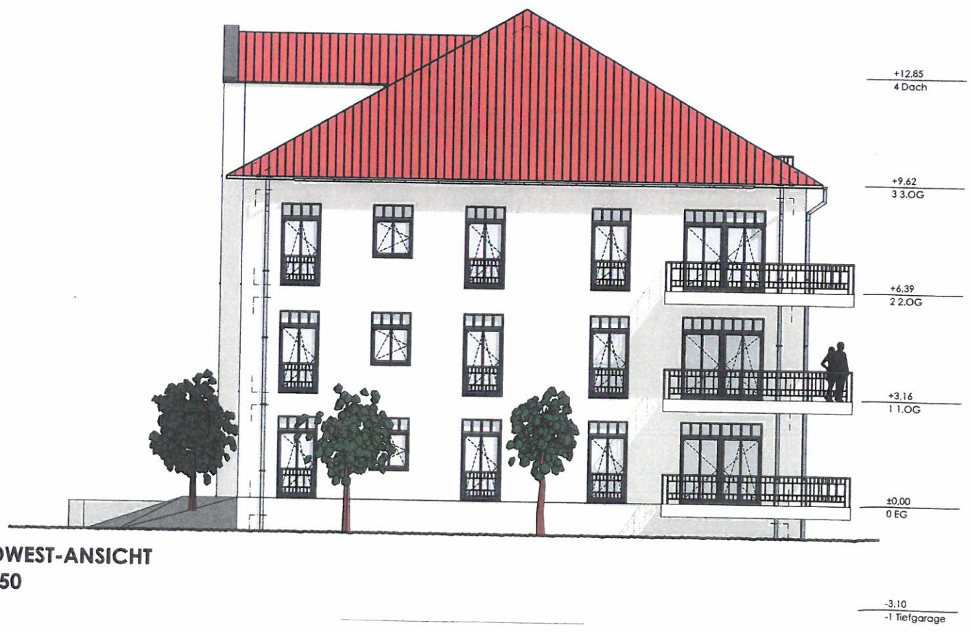
NORDWEST-ANSICHT M 1:150