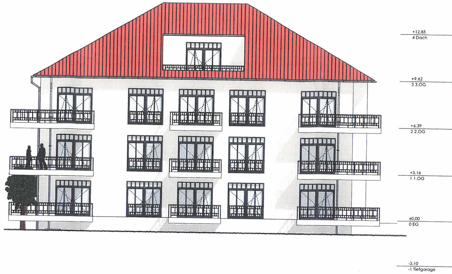
SÜDWEST-ANSICHT M 1:150