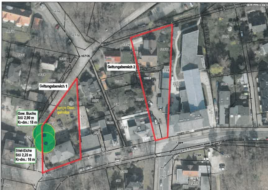
Abbildung 1: Naturschutzrechtlich relevanter Bestand in den Geltungsbereichen 1 und 2

Artenschutz: Es ist potentiell möglich, dass in Gehölzen brütende kommune Brutvogelarten in dem Hausgarten vorkommen. Um diese potentiell vorkommenden Brutvögel nach § 44 Abs. 1 Nr.1 bzw. Nr. 2 BNatSchG nicht direkt bei bau- und bauvorbereitenden Maßnahmen zu beeinträchtigen bzw. in deren Brutzeit erheblich zu stören, ist die Beseitigung von Gehölzen nur im Zeitraum vom 01.10. bis 28.02. eines jeden Jahres zulässig.