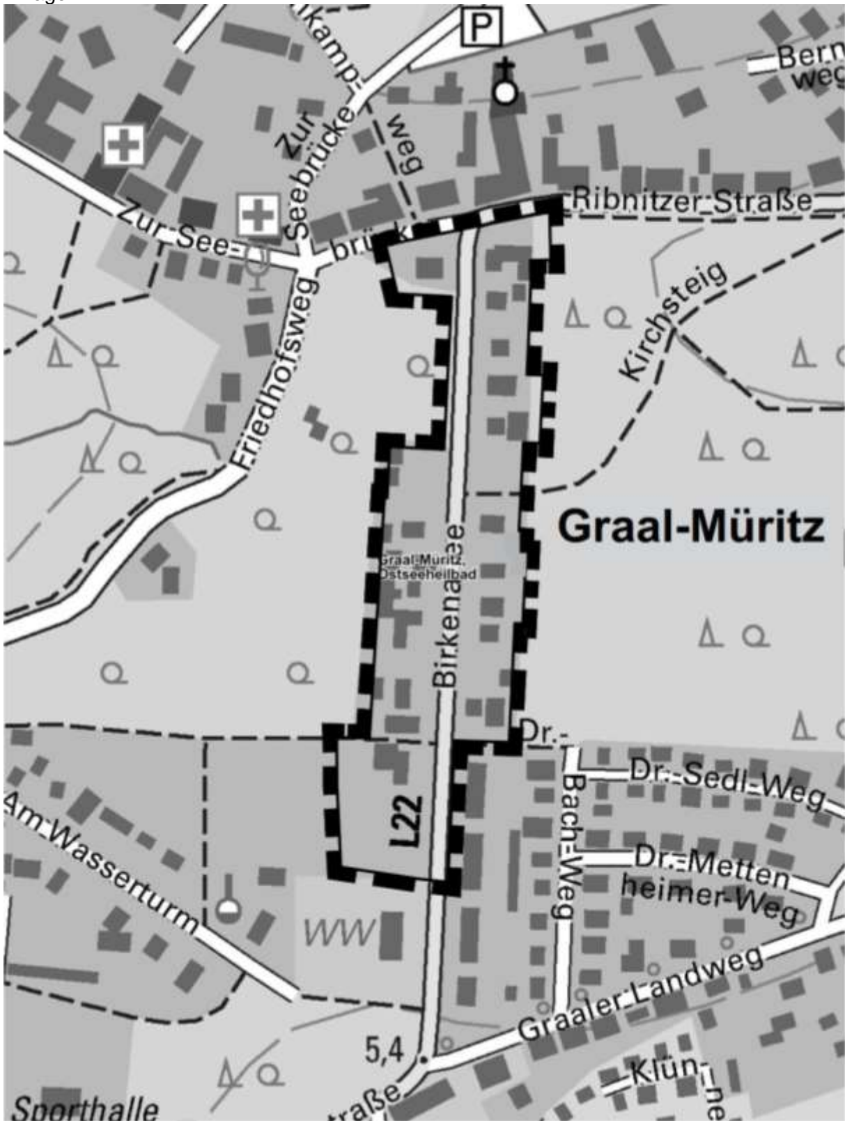
Auszug aus der topographischen Karte