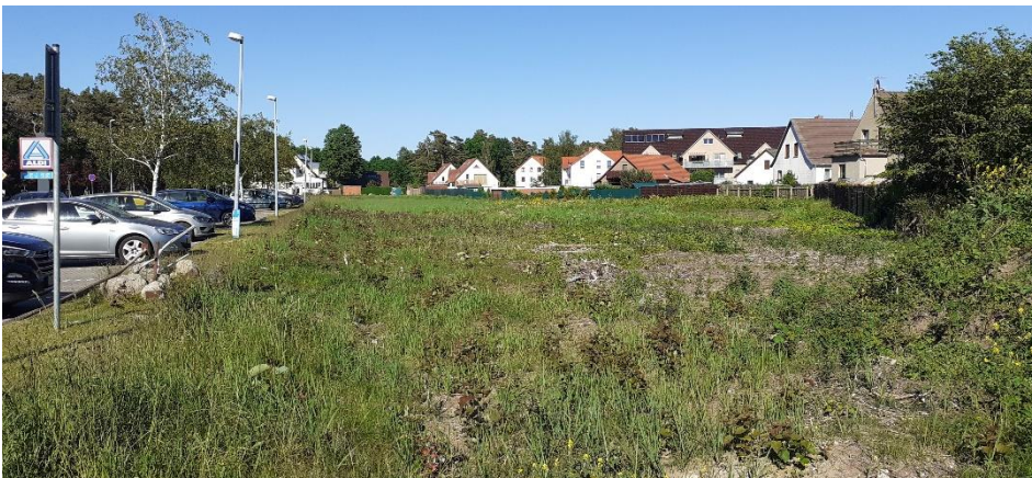
Abbildung 2: Blick vom Lebensmittelmarkt in das Plangebiet

Die rückwärtig zur Bahnhofstraße gelegenen Flächen stellen sich aktuell überwiegend als Brachfläche dar. Bereits vor längerer Zeit wurden die Gleisanlagen zurückgebaut sowie die Flächen des ehemaligen Bahnhofes beräumt. Daran grenzen außerhalb des Plangebietes Grundstücke mit Wohnbebauung an.