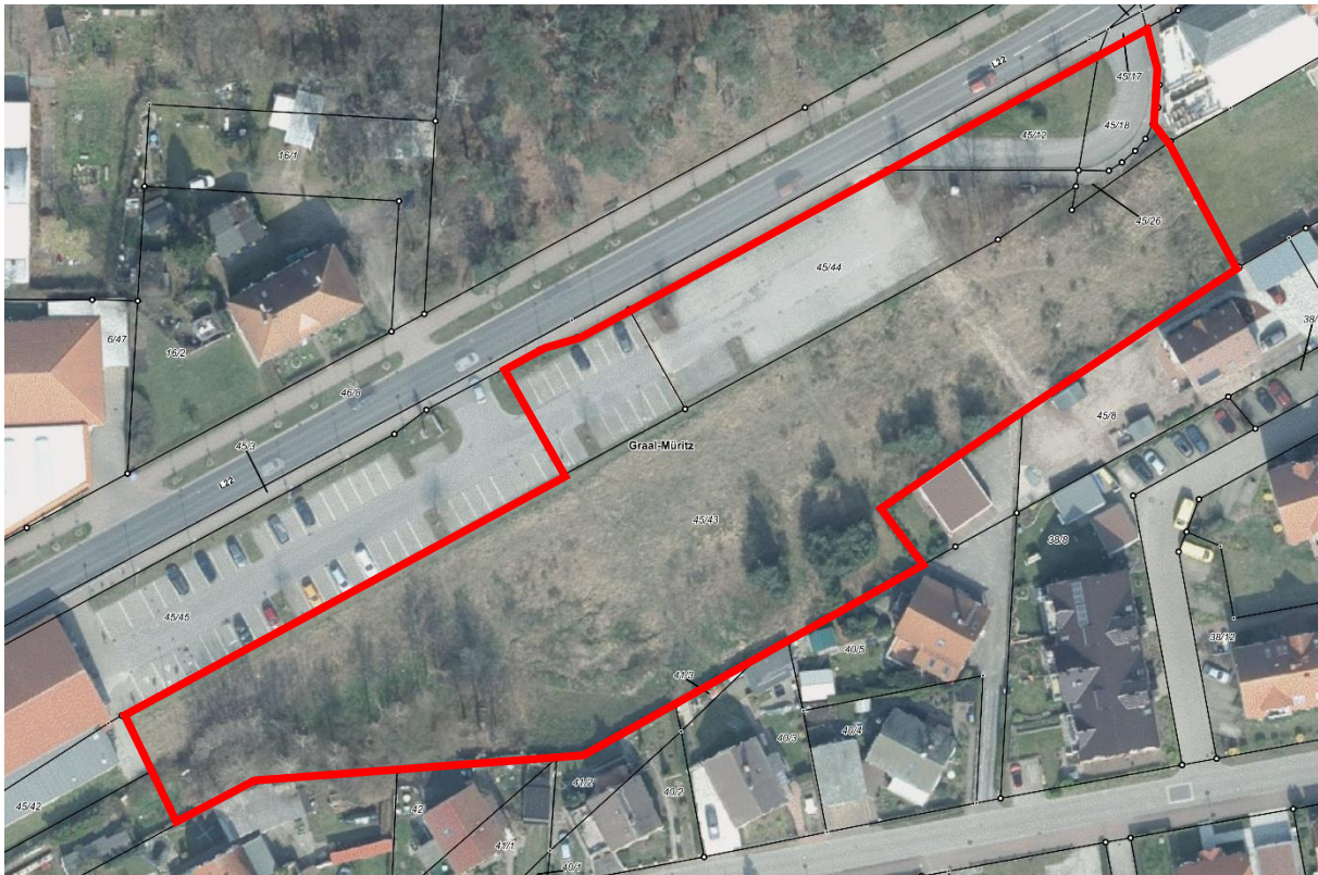
Abbildung 1: Lage des Plangebietes auf Grundlage des Luftbildes mit ALK

Flurstücke 45/12, 45/18, 45/26, 45/43 (teilw.), 45/44 und 45/45 (teilw.) der Flur 2 in der Gemarkung Graal.