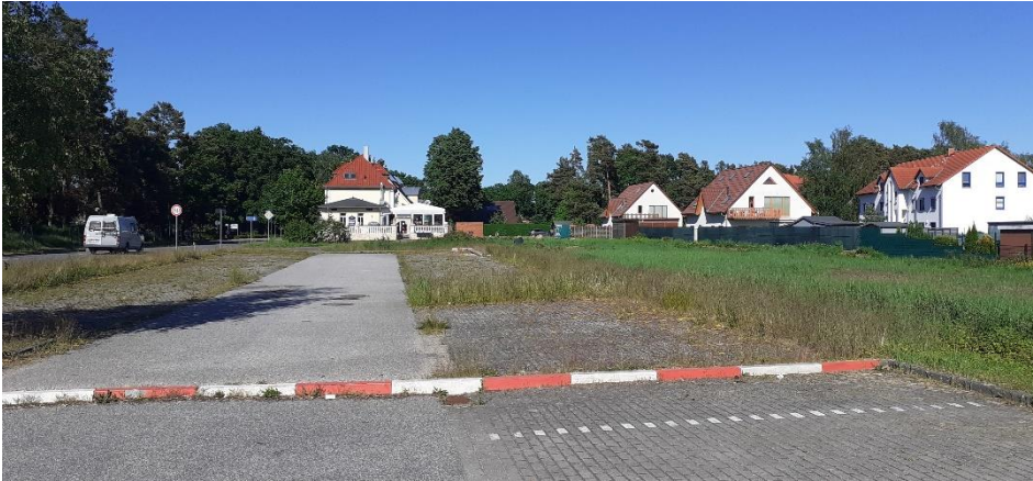
Abbildung 3: Blick vom Parkplatz des Lebensmittelmarktes in Richtung Restaurant

Für den Änderungsbereich besteht der Bebauungsplan Nr. 23-05 in der Fassung der 1. Änderung aus dem Jahr 2012 (siehe nachfolgende Abbildung).