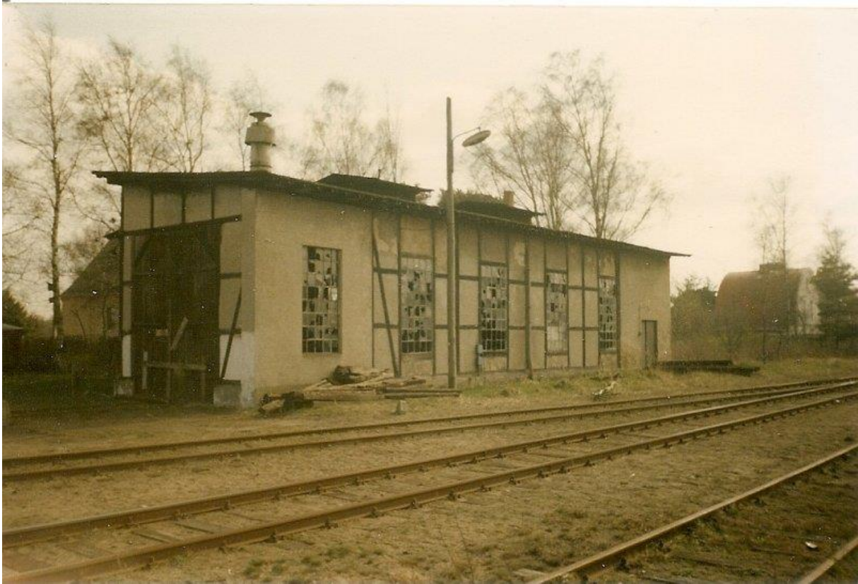
Der alte Lokschuppen