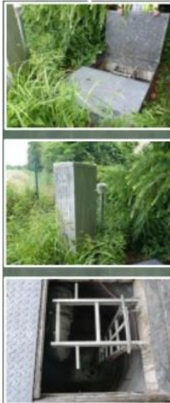
Fotos vom SW Koppenheide