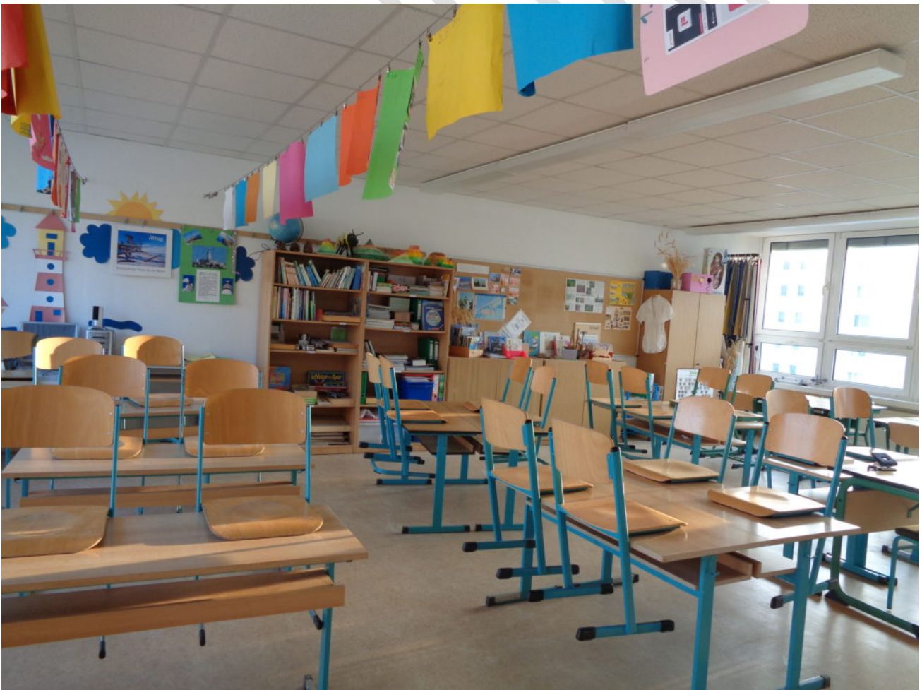
Abbildung 3: Ansicht Unterrichtsraum Ostsee-Grundschule Graal-Müritz

Für den Unterricht stehen fünf Klassenräume, ein Werkraum sowie ein Musikraum/PC-Raum zur Verfügung. Es gibt, zusätzlich zu den Klassen- und Fachräumen diverse Vorbereitungsräume (u. a. für Sachunterricht, Werken), eine Bibliothek, ein Spielzimmer und ein Förderraum.