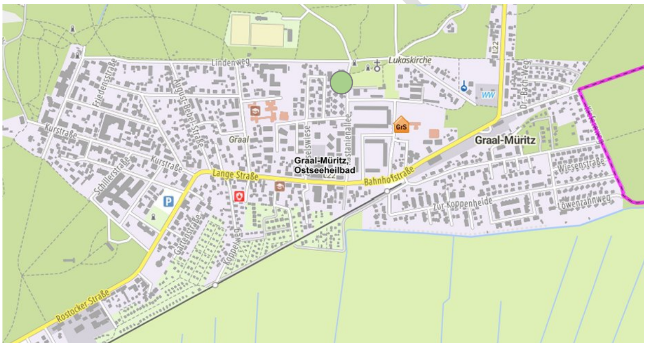
Abbildung 2: Standort der Ostsee-Grundschule Graal-Müritz

Die Ostsee-Grundschule Graal-Müritz liegt östlich im Ostseeheilbad inmitten eines Wohngebietes. Angrenzend an das Gebäude befindet sich ein großzügiger Schulhof mit Sportmöglichkeiten, eine Sporthalle, ein Verkehrs- sowie ein Schulgarten.