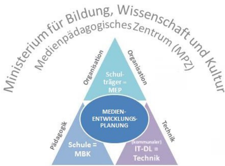
Abbildung 1: Rollen im System Schule

Durch den Einbezug aller beteiligten Rollen wird einerseits Transparenz gewährleistet, aber auch die Planbarkeit erhöht, indem Zielszenarien für Ausstattung, Infrastruktur und Medieneinsatz auf Basis medienpädagogischer Konzepte beschrieben, Abläufe sowie Strukturen geplant und diese jeweils in einen finanziellen Rahmen gebettet werden.