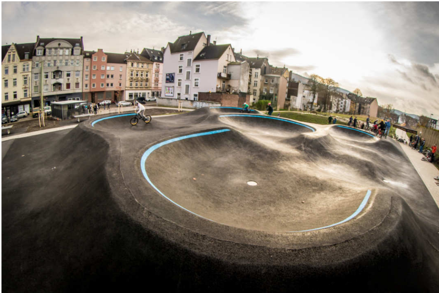
Hagen, Freizeitgelände „Bohne“

Vollflächig asphaltierter Pumptrack in einer Sport- und Freizeitanlage