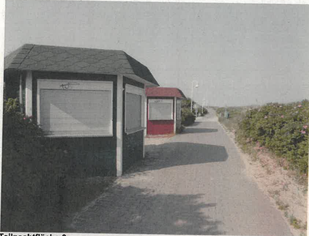
Teilpachtfläche 3 Gemarkung Müritz, Flur 1, Flurstück 1/5 1 x Versorgungskiosk