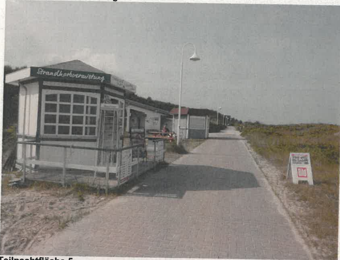
Teilpachtfläche 5 Gemarkung Müritz, Flur 1, Flurstück 1/5 1 x Versorgungskiosk